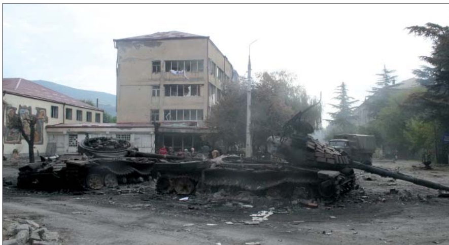
На улицах Цхинвала. Август 2008 г.

Российские воинские колонны на них подействовали ободряюще, как живительный дождь на иссушенную землю. Нам махали руками, приветствовали, что-то кричали, протягивали хлеб, воду и фрукты, которых у них и так-то было немного.