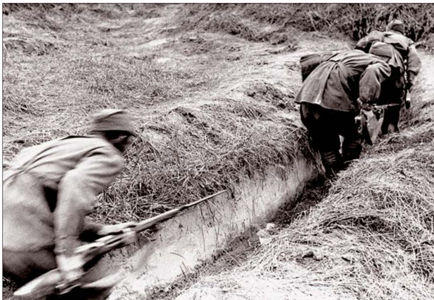
Пехотинцы готовятся к отражению атаки. 1942 г.