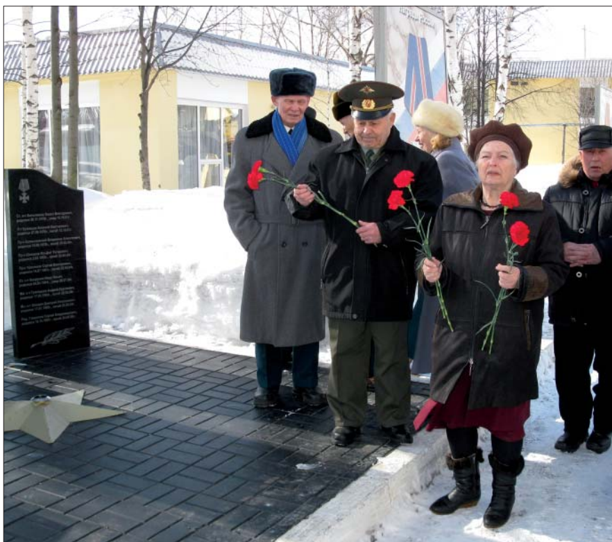
Ветераны возлагают цветы к памятнику погибшим бойцам казанского отряда специального назначения. Февраль 2012 г.