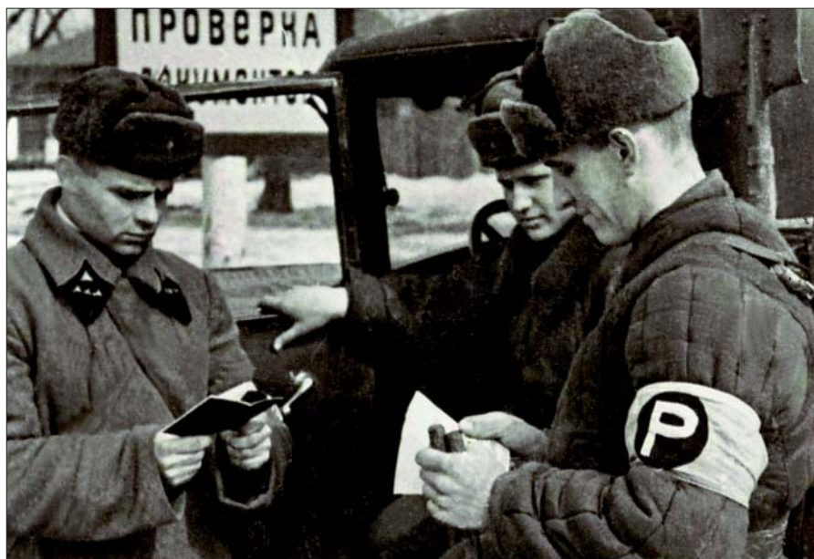
Проверка документов на КПП войск НКВД 1942 г.

Вскоре мы стали нести заградительную службу по охране армейского тыла. Это не заградотряды, это