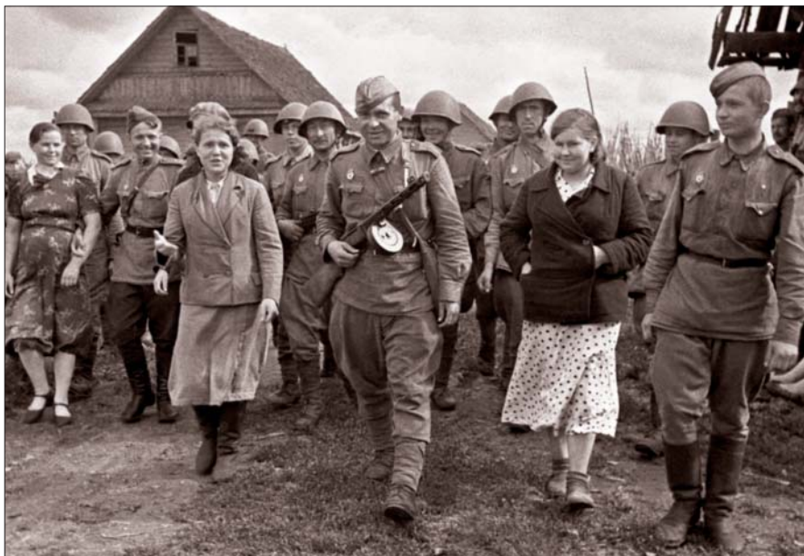
Встреча освободителей. Белоруссия, 1944 г.

ТАК УЖ вышло, что заканчивать войну мне довелось там же, где и начинать – в родной Белоруссии. С боями наш полк дошёл до Могилёва, участвовал в освобождении города.