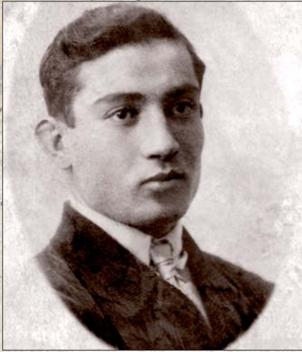
Магомед Макоев погиб в Восточной Пруссии в феврале 1945 г.