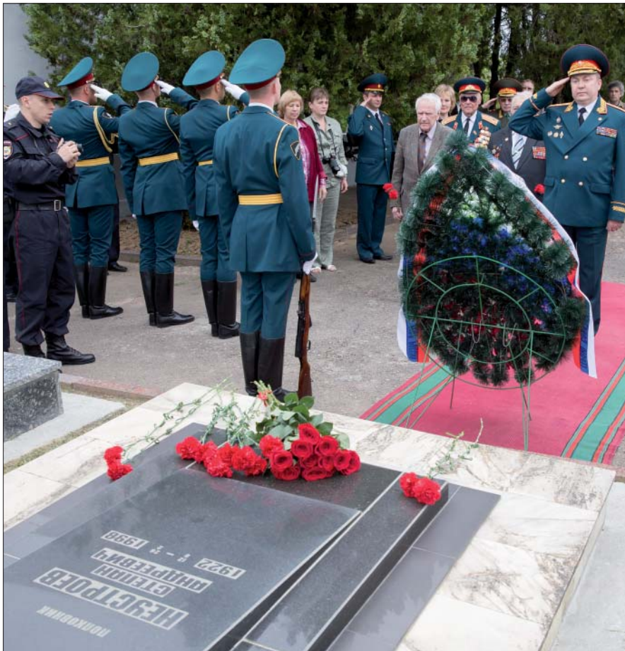
На могиле Героя Советского Союза полковника Степана Андреевича Неустроева. Севастополь, 2014 год