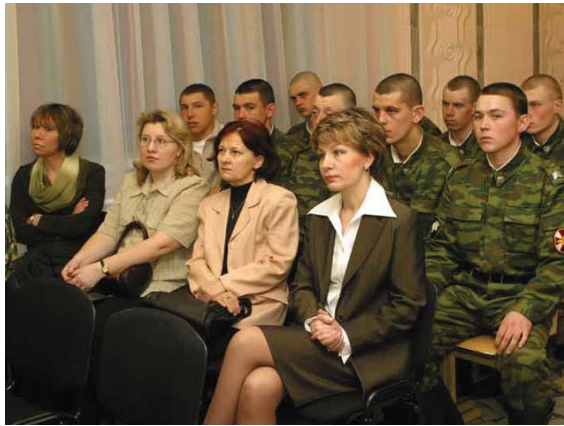
Педагоги и выпускники "солдатской школы" на торжественном собрании