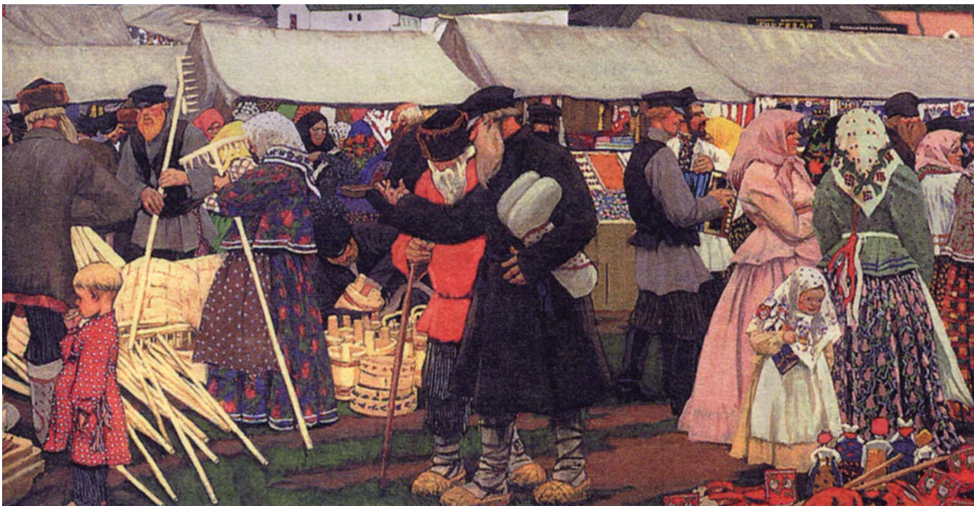
“Ярмарка”. Фрагмент картины Б.М. Кустодиева

И вот обремененный, по сути, неограниченной властью столичный генерал приступил к наведению порядка не только в Нижнем, но и во всем Приволжском крае. Еще задолго до начала торгов главные дороги перекрыли войсковые пикеты. На территории самой ярмарки, а также в близлежащих городских кварталах и вокруг “зланных мест” стали нести службу пешие и конные караульные наряды (парули) внутренней стражи. На улицы вывели чуть ли не всех чинов городской полиции — “для более удобного и скорейшего прекращения всякого беспорядка”.