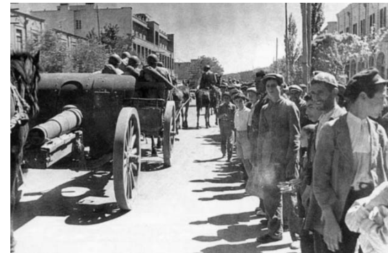
Части РККА вступают в г. Тавриз (северо-западный Иран). Сентябрь 1941 г.

Продвижение эшелонов с частями, вооружением и военной техникой 44 и 47-й армий Закавказского фронта по территории Северного Ирана на участке Джульфа — Тавриз Тавризской железной дороги обеспечивали линейные гарнизоны и бронепоезд 1-го