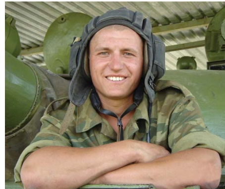
Лучший механик-водитель части гордится службой во внутренних войсках