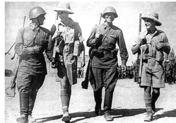
Советские и британские войска в Иране (г. Мехабад). Сентябрь 1941 г.