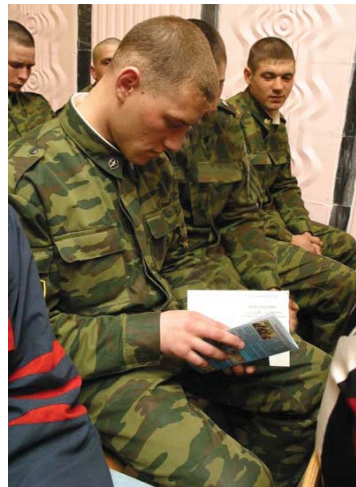
Теперь открыты все дороги