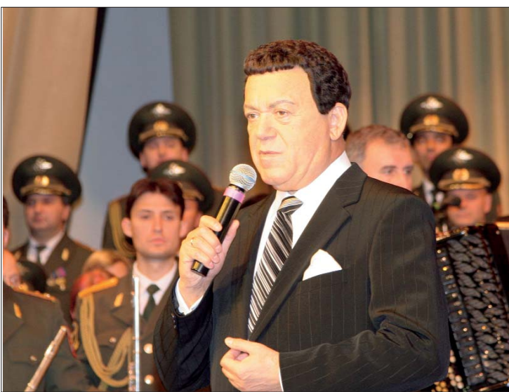
Иосиф Кобзон на концерте с Академическим ансамблем