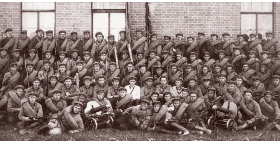
Экспедиционный отряд 2-го Дальневосточного кавполка войск ОГПУ. 1928 г.

Якутия встречала воинов-чекистов крепким морозом и сильными ветрами, дувшими с заснеженного