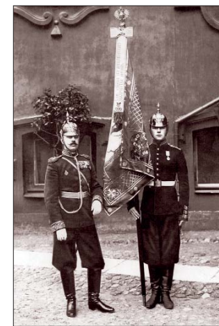
Полковой штандарт – воинская святыня