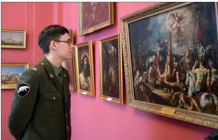
На художественной выставке, г. Тамбов

реть другими глазами), а третий будет искать возможный лишний раз попасть в дивизионный музей, где всё пронизано историей войск.