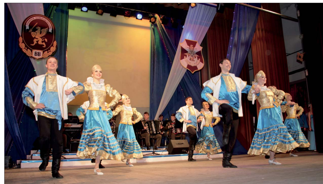
Балетная группа ансамбля песни и пляски Сибирского регионального командования ВВ МВД России

Для неумеренных оптимистов, порадовавшихся призыву в войска выпускников гражданских университетов и институтов, замечу, что и