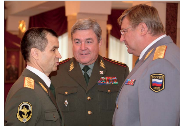
В день празднования 35-летия Академического ансамбля песни и пляски ВВ МВД России

Если вычленим из всей системы МПО культурно-досуговую работу,