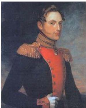
Цесаревич Николай Павлович, 1823 г.