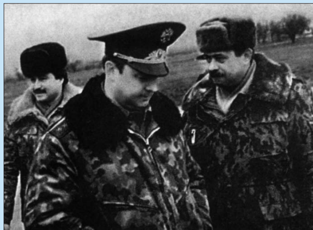
Грозный. 1989 г.

ши первые инструкторы. Там, на местах, мы должны были исполнять роль живого щита между противоборствующими сторонами. Но пришлось стать ещё и воспитателями, дипломатами, спасателями. При этом с совершенно непонятным статусом. Мы вывозили из Средней Азии на Кавказ турок-месхетинцев. Причём часть из них переправили в Карабах, где уже пробивались языки близкого пожара.