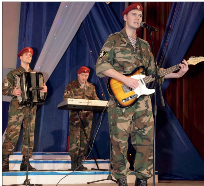
Вокально-инструментальная группа ансамбля песни и пляски Северо-Западного регионального командования ВВ МВД России

Не станем сегодня детально рассуждать о проблеме подготовки кадров для полноценной воспитательной, а если ещё конкретнее, культурно-досуговой работы – это тема отдельного большого разговора. Напомним лишь, что любой наш офицер – это учитель для солдат, для своих подчинённых. Учить он должен, кроме всего прочего, и личным примером. Принцип “Делай, как я” всегда важен в отношениях “начальник – подчинённый”, “офицер – солдат”.