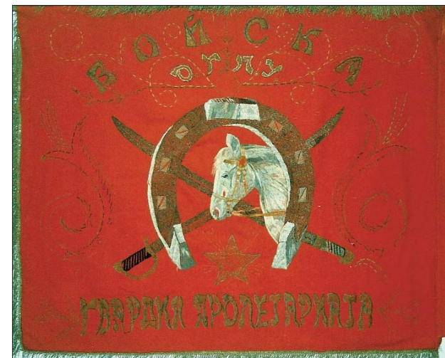
Шефское знамя 2-го Дальневосточного кавполка войск ОГПУ