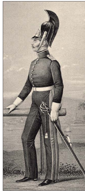
Рядовой жандармских команд и дивизионов внутренней стражи

Негодующий государь выслал против бунтовщиков конногвардейцев. Но те больше дефилировали вокруг выстроившихся в каре москвичей, лейб-гренадёров и моряков. Да и трудно было им провести лихую атаку по гололёду на неподкованных лошадях. К тому же со стороны мятежников прозвучало несколько дружных залпов. Большая часть пуль просвистела поверх голов, но несколько кавалеристов всё же были выбиты из седёл. Николай Павлович был встревожен не на