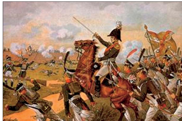
Под Боевым знаменем – в атаку на врага