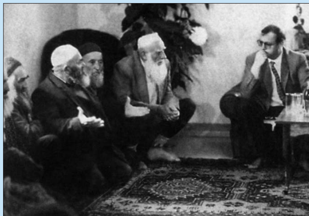
Карабах. Беседа со старейшинами. Май 1998 г.