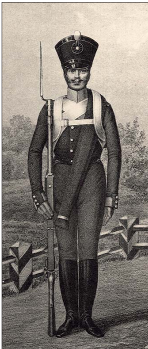
Нижний чин внутренней стражи

После разгрома мятежных батальонов Комаровский силами поступивших в его распоряжение столычных гвардейских частей немедленно организовал комендантскую службу во всех прилегающих к Сенатской площади районах северной столицы. В результате в городе было задержано более 700 солдат и офицеров взбунтовавшихся частей, которые, покинув площадь, пытались скрыться в домах и во дворах. Все они конвоировались в Петропавловскую крепость специально назначенным графом Комаровским для выполнения этой задачи батальоном лейб-гвардии Семёновского полка и дивизионом кавалергардов в личном присутствии командира Отдельного корпуса внутренней стражи. “Я воз-