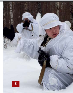
БОЕВАЯ УЧЁБА 8 ПЕШКИ – НЕ ОРЕШКИ