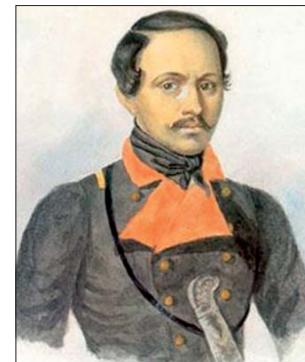
М.Ю. Лермонтов в мундире Тенгинского полка

Укрепление Михайловское, построенное в 1837 году близ устья реки Вулан, входило в состав форпостов пограничной черноморской берего-