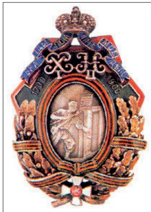
Нагрудный знак 77-го Тенгинского пехотного полка

Окружённые со всех сторон храбрые защитники форта прекрасно понимали, что озверевшие от крови черкесы не пощадят никого. И продолжали упорно сопротивляться. Однако силы русских воинов были на исходе. В последний момент ря-