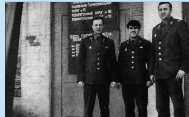
Мы победили! Выборы в Верховный Совет Российской Федерации. Ленинград. 112-й территориальный округ