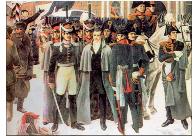
Декабрист. Худ. В. Псарёв. Иллюстрация декабристского мифа

Декабристы... Какими представляют их нынешние россияне, вспоминая школьные уроки истории и душещипательные эпизоды некогда культового фильма “Звезда пленительного счастья”? Благородными молодыми людьми, мечтавшими о свободе и справедливости. Самоотверженными борцами, бросившими вызов “проклятому царизму”. Героями, готовыми ради благополучия народа пожертвовать собственной жизнью. Но это всего лишь красивая легенда, весьма далёкая от реальности. Устойчивый миф, созданный революционной интеллигенцией, советским официозом и либералами-“шестидесятниками”. Верно сказал известный критик: “Нет такой глупости, которой не написали бы о декабристах”. Кем же на самом деле были эти “рыцари свободы”, как патетически назвал их Герцен? Откуда позаимствовали демократические идеи? Как собирались обустроить Россию? И, самое главное, кто стоял за спинами заговорщиков, управляя революционными действиями? Основатели и многие влиятельные участники движения декабристов принадлежали к высшей аристократии и, ратуя за крутые общест-