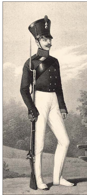
Рядовой уездных команд внутренней стражи

Николай Павлович пребывал в ярости и смятении: его старший брат, вопреки всем Божьим и человеческим законам отказавшийся взять на себя бремя самодержавия, находился в Варшаве. А главное, он так и не прислал текст обязательного в подобных случаях высочайшего манифеста об отказе от своих притязаний на российский трон. Неужели Константин не предполагал, в какую бездну он может свергнуть страну?..