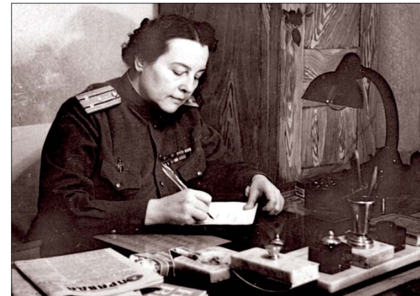
Начальник разведотдела полковник Зоя Вознесенская (Рыбкина). Начало 50-х годов

Очень хочется надеяться, что в будущем удастся обнаружить новые подробности о судьбе Анны Аркадьевны Рязановой – сестры мило-