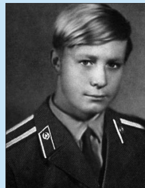
На 4-м курсе ВПУ. 1972 г.

– К страшным событиям в то время ещё родных союзных республиках мы были совершенно не готовы. Ни преподаватели, ни курсанты, ни на-