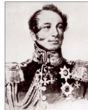
Командир отдельного корпуса внутренней стражи генерал-адъютант граф Е.Ф. Комаровский