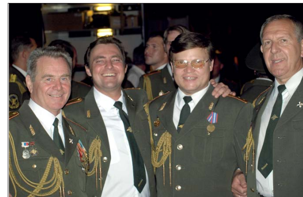
Главные солисты Академического ансамбля

Пусть все военные институты говорят сегодня командиров по одинаковым программам. Но ведь в Санкт-Петербурге весь воздух пропитан вековой, великой русской культурой! Неужели за пять лет учёбы в вузе его воспитанники не могут проникнуться ею хоть чуточку больше других? Даже если они всё своё время проводят в стенах альма-матер, неужели там напрочь утрачены традиции, о сохранении которых твердим, – традиции святоотеческие, славные боевые, культурные, наконец? 2000 (две тысячи!) участников войскового смотра-конкурса самостоятельной авторской песни боролись за право выступить в его заключительном концерте. А командование Санкт-Петербургского военного института не обеспечило и здесь участие своих представителей. Как тут не вспомнить не такую