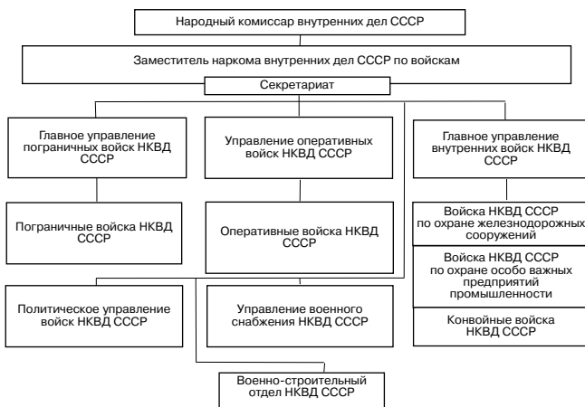
Рис. 2. Структура органов управления войсками НКВД СССР. Август 1941 года

В соответствии с приказом НКВД от 13 августа 1941 года № 001075 было осуществлено реформирование Главного управления войск НКВД СССР по охране железнодорожных сооружений и особо важных предприятий промышленности, а спустя две недели, 26 августа, на основании приказа НКВД СССР № 001155 было расформировано Управление конвойных войск. Вместо упраздненных войсковых управлений создано Главное управление внутренних войск (ГУВВ) НКВД СССР, в состав которого вошли отделы, руководившие службой конвойных войск и войск по охране железнодорожных сооружений и особо важных предприятий промышленности. Общая численность Главного управления внутренних войск НКВД СССР составляла 260 штатных единиц (рис. 2).