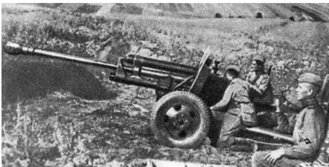
Артиллеристы на Курской дуге

уничтожили до 30 немецких танков. Батарея капитана И.Г. Игишева, только 9 июля 1943 года уничтожила 19 танков противника 1 .