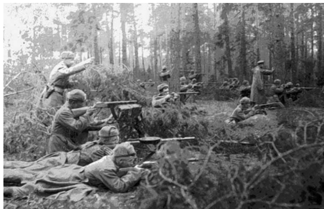
Бой по уничтожению банды националистов

Так, в тылу 1-го Белорусского фронта с 25 мая по 10 июня 1944 года войсками НКВД по охране тыла была проведена операция, которая охватила войсковые, армейские тылы и часть фронтового тылового района. Глубина территории, на которой развернулась операция, достигала 300 км, ширина – до 100 км. Общая площадь территории, где проводилась операция, равнялась 30 тыс. км 2 . К проведению операции были привлечены пять по-