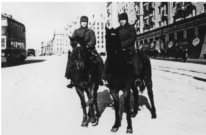
Конный патруль от ОМСДОНа. Москва 1941 год