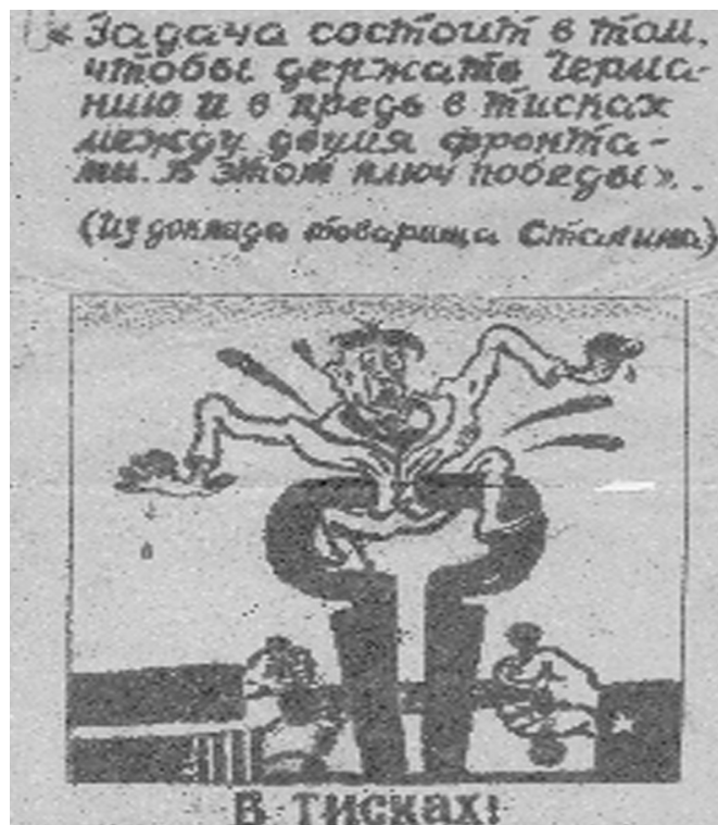
Боевой листок 272-го полка 10-й стрелковой дивизии войск НКВД в ходе Сталинградской битвы

С первых дней войны важнейшей задачей стало воспитание ненависти к врагу у советских людей и воинов действующей армии. Для красноармейцев и младших командиров начали проводиться политинформации и беседы: "Фашизм – злейший враг славянских народов", "Кто такие национал-социалисты", "Что такое гитлеровский новый порядок в Европе", "Зверства фашистских оккупантов". В систему политической учебы были включены темы "Германский разбойничий империализм", "Фашистские зверства над пленными", "Отомстим гитлеровским разбойникам за все злодеяния, причиненные ими нашему народу" и др. 6 В этой работе активно использовалась наглядная агитация. На стендах и витринах помеща-