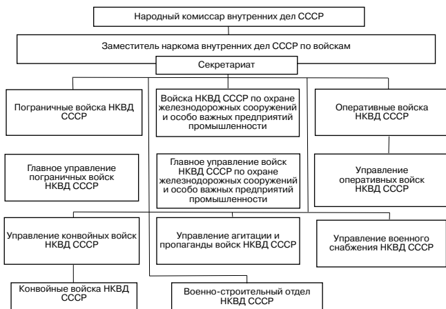
Рис. 1. Структура органов управления войсками НКВД СССР накануне войны. Июнь 1941 года

ных районах страны, потребовало создания единого органа управления войсками.