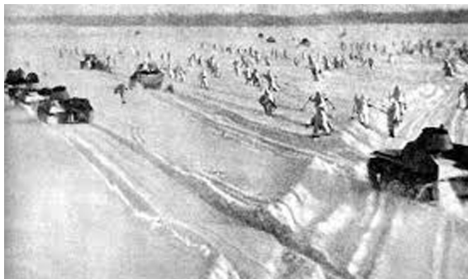
Контрнаступление советских войск под Москвой

20 октября 1941 года постановлением Государственного Комитета Обороны в Москве и прилегающих к городу районах было введено осадное положение. На войска НКВД Московского гарнизона дополнительно была возложена охрана обществен-