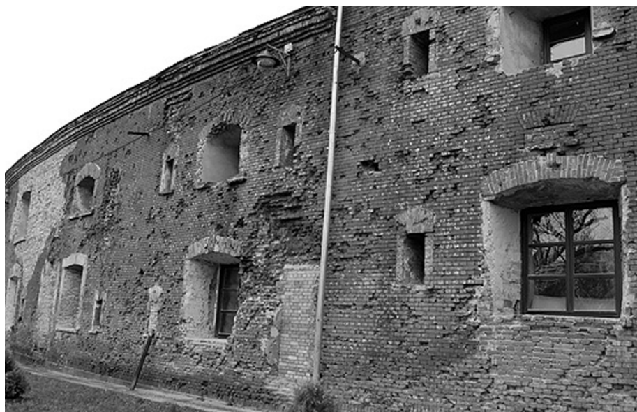
Казарма 132-го отдельного батальона войск НКВД между Тереспольскими и Холмскими воротами Брестской крепости

Генерал-полковник С.В. БУНИН – начальник главного штаба внутренних войск – первый заместитель главнокомандующего внутренними войсками МВД России, кандидат педагогических наук, заслуженный военный специалист Российской Федерации