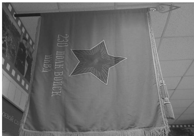
Красное знамя полка войск НКВД образца 1943 года

Целенаправленную работу по пропаганде военно-патриотической литературы проводили библио-