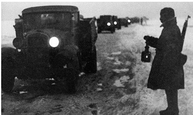
Дорога жизни на Ладоге