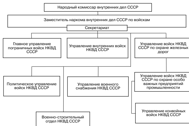
Рис. 3. Структура органов управления войсками НКВД СССР. Январь 1942 года

Увеличение численности внутренних войск НКВД СССР и войск НКВД, находящихся в подчинении начальников охраны тыла фронтов, а вследствие этого и объема работы Управления внутренних войск НКВД СССР объективно потребовало его реформирования. Приказом НКВД СССР от 28 апреля 1942 года № 00852 оно было преобразовано в Главное управление внутренних войск НКВД СССР, в составе которого было организовано Управление войск НКВД СССР по охране тыла действующей Красной Армии 2 . В этом новом органе управления сосредоточивалось руко-