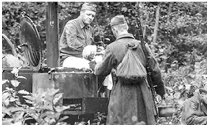
Организация питания личного состава в полевых условиях

Обеспечение воинских частей НКВД, осуществляющих охрану тыла действующих армий, организовывалось органами снабжения управления войск НКВД