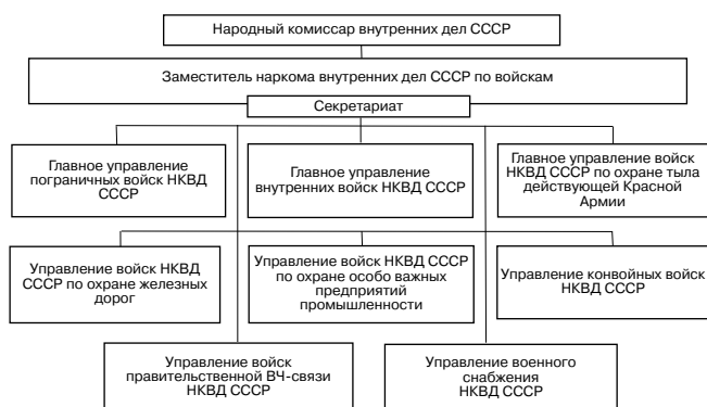
Рис. 5. Структура органов управления войсками НКВД. Июль 1943 года

правления войсками НКВД, сложившаяся к середине 1943 года (рис. 5), практически без изменений просуществовала до конца Великой Отечественной войны.