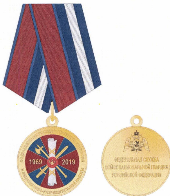
лицевая сторона оборотная сторона

памятной медали Федеральной службы войск национальной гвардии Российской Федерации «50 лет со дня образования подразделений государственного контроля и лицензионно-разрешительной работы»