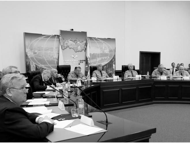
Научно-техническая конференция (ГКВВ МВД России, 24 января 2013 г.).

разработка специальных плавсредств и оборудования, в целях повышения качества выполнения служебно-боевых задач по охране важных государственных объектов и сооружений на коммуникациях, расположенных в прибрежной части водных объектов;