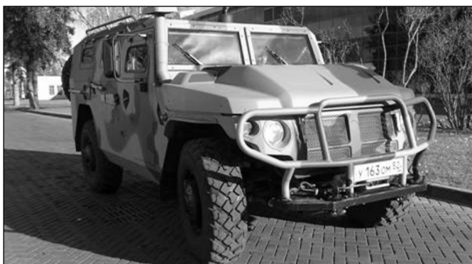
Рис. 5. Специальная бронированная машина СБМ