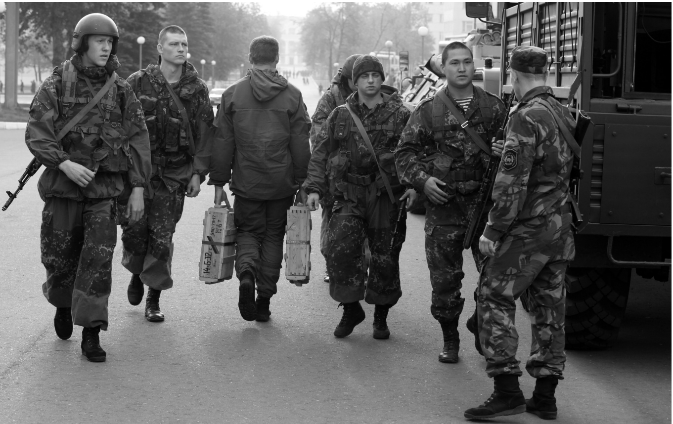
Работа по комплектованию должностей солдат и сержантов военнослужащими по контракту – главная задача внутренних войск на 2013 год

качественному укомплектованию воинских должностей сержантов и солдат военнослужащими, проходящими военную службу по контракту, путем установления конкретных заданий каждой воинской части;