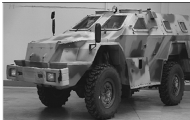
Рис. 8. Специальный бронированный автомобиль КамАЗ-43269 "Быстрел"

Одной из основных целей данной работы являлось достижение уровня защиты машин, создаваемых за рубежом в соответствии с программой MRAP. На СПМ-3 применена оригинальная разнесенная дифференцированная защита. Применительно к отечественному ГОСТ 50963-96 по баллистической защите машина соответствует 6 классу, а по противоминной защите – 2а классу. Другими словами, корпус и бронестекла машины выдерживают попадание 7,62-мм бронебойной пули Б-32, выпущенной с расстояния 100 метров из вин-