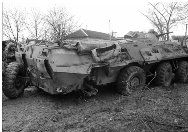
Рис. 2. Результаты подрыва отечественной техники при проведении контртеррористической операции

Бронемодуль спецавтомобиля "Федерал", выдерживает подрыв снаряда ОФ-26 на расстоянии 2,5 м, а