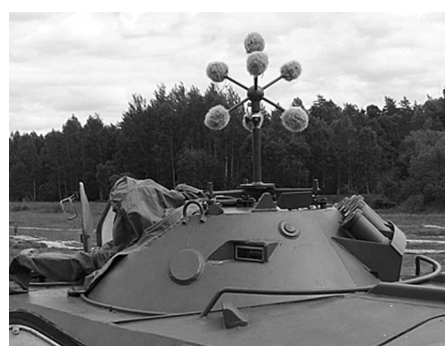
Акустические системы обнаружения выстрелов "Сова" и "Сова-М"