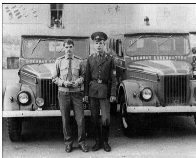
Военнослужащие первого комендантского подразделения

Вступают в действие: Федеральный закон Российской Федерации № 40 "Об обязательном страховании гражданской ответственности владельцев транспортных средств"; постановление Правительства Российской Федерации № 938 "О государственной регистрации автотранспортных средств и других видов самоходной техники на территории Российской Федерации", № 431 "О проведении государственного технического осмотра транспортных средств, зарегистрированных военными автомобильными инспекциями (автомобильными службами)", № 20 "Об утверждении Положения о сопровождении транспортных средств автомобилями Государственной инспекции безопасности дорожного движения Министерства внутренних дел Российской Федерации и военной автомобильной инспекции". На основании этих государственных актов издаются приказы министра внутренних дел и главнокомандующего внутренними войсками МВД России, регламентирующие деятельность военной автоинспекции внутренних войск МВД России. В каждую воинскую часть вводятся штатные инспектора военной автоинспекции и специальные патрульные автомобили АП-ВАИ. В региональных командованиях и