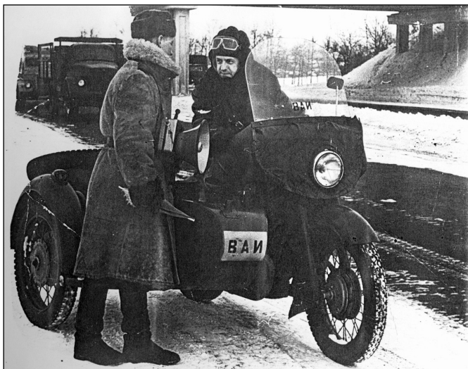
На службе по регулированию дорожного движения

ство ДТП с участием нетрезвых водителей. Статистика по аварийности стала принимать угрожающий характер. Ежегодно в результате ДТП в России погибало до 30 тысяч человек и до 300 тысяч человек получали тяжелые увечья. Помимо невосполнимых людских потерь, страна несла миллиардные убытки в экономике. По основным показателям аварийности мы выглядели хуже многих развивающихся стран.