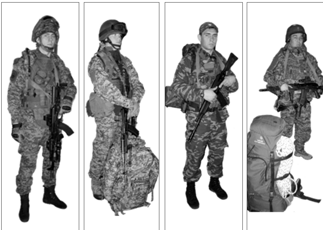
Рис. 1. Варианты экипировки военнослужащих

ления. В номенклатуре отсутствует ряд необходимых элементов, масса носимой части на 10 – 20 процентов тяжелее иностранных комплектов. При этом превышение оптимальной нагрузки на тело военнослужащего достигает 40 процентов, что вызывает быструю утомляемость личного состава и снижает его боеспособность.