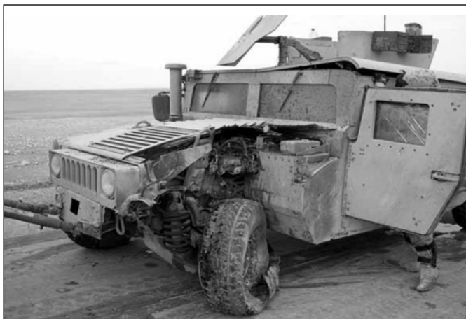
Рис. 1. Результаты подрыва зарубежной техники в ходе ведения боевых действий в Афганистане

ослабление кратковременных перегрузок за счет создания разгрузочных сидений.