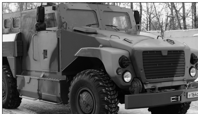
Рис. 6. Специальная полицейская машина СПМ-3