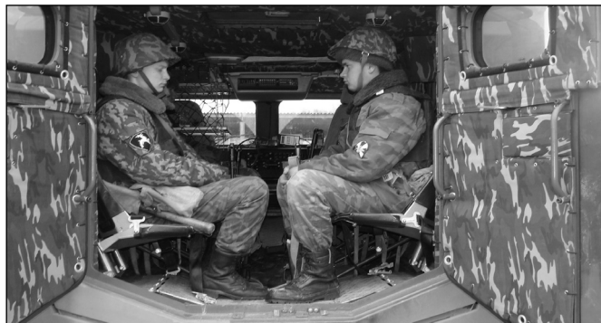
Рис. 7. Государственные приемочные испытания СПМ-3

оснастить нелетальным вооружением и другим спецоборудованием;