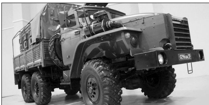
Рис. 3. Бронированный грузовой автомобиль Урал-55571 "Федерал"

Были определены следующие требования: увеличить высоту обитаемого отсека; довести уровень бронезащиты с 3 до 5 класса защиты;