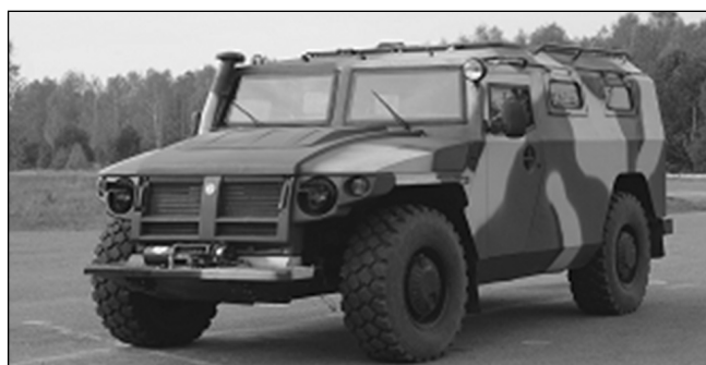
Рис. 4. Специальная полицейская машина СПМ-2 (ГАЗ-233036 "Тигр")