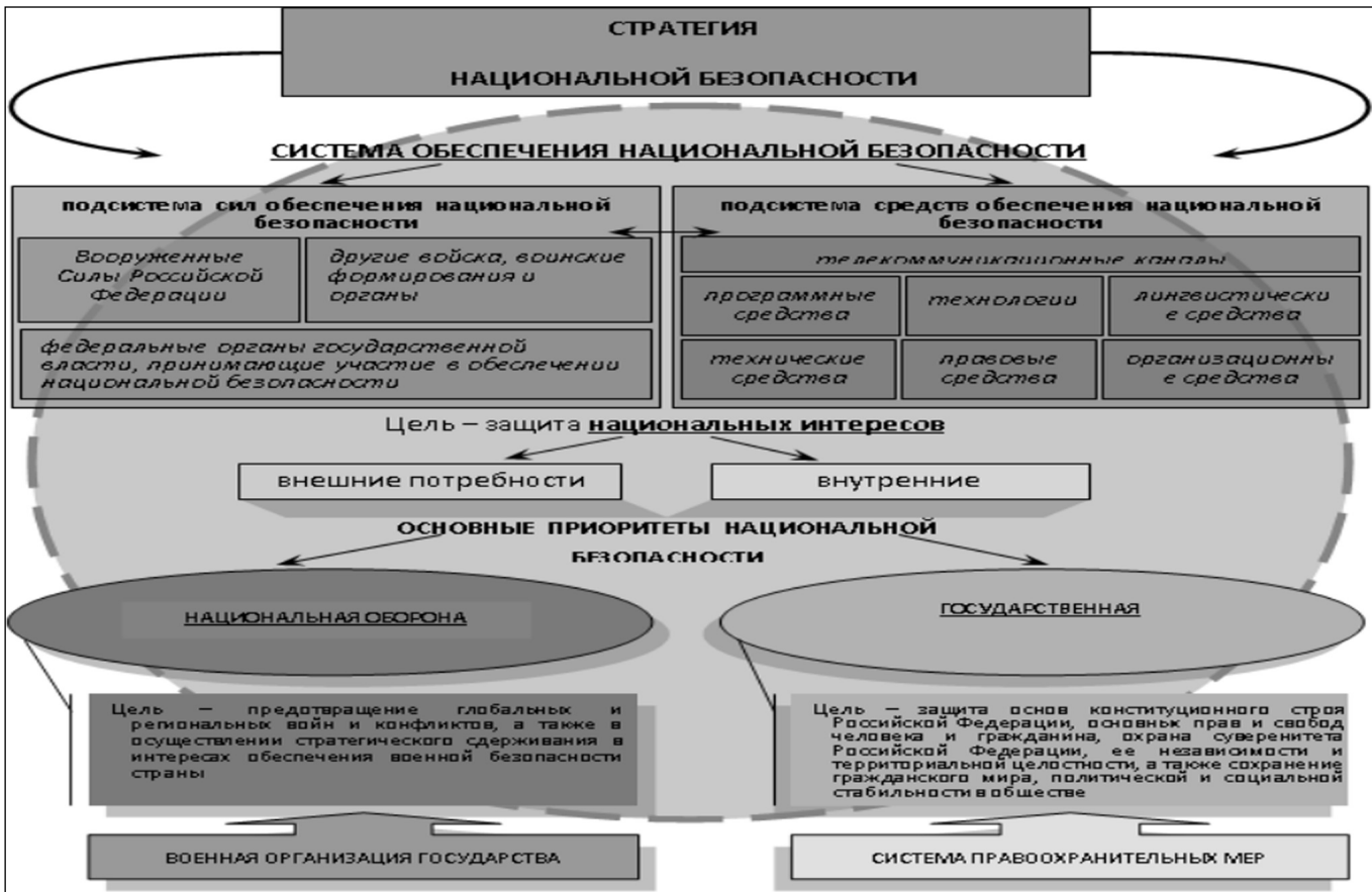
Рис. 1. Система обеспечения национальной безопасности

учетом результатов исследований, проводимых по разработанному в алгоритму, включающему в себя пять основных этапов (рис. 2).