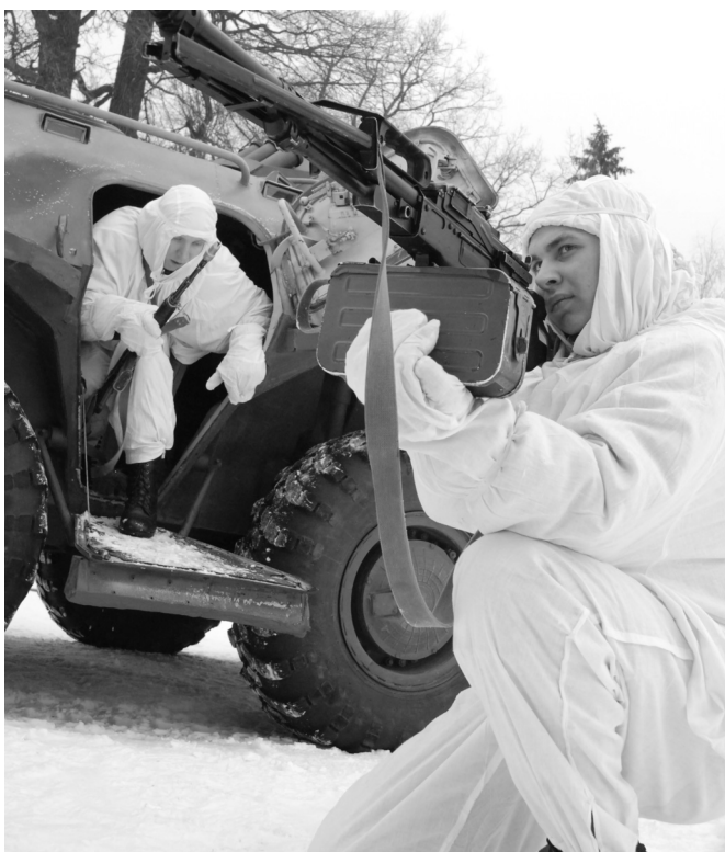
На войсковом стрельбище контрактники софринской бригады ВВ МВД России

После получения положительных ответов на запросы из органов внутренних дел, заверенных печатью, специалист по отбору кандидатов на военную службу по контракту оформляет личное дело гражданина, поступающего на военную службу по контракту.