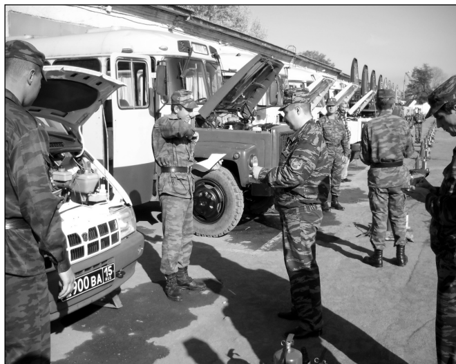
Проведение государственного технического осмотра транспортных средств

к техническому освидетельствованию в установленных случаях в органах Ростехнадзора оборудова-