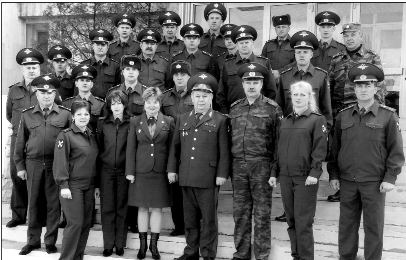
Участники первого учебно-методического сбора должностных лиц ВАИ (г. Новочеркасск, 2007 г.).

эксплуатации, иных противоправных действий, влекущих угрозу безопасности дорожного движения и принятие мер по их устранению.