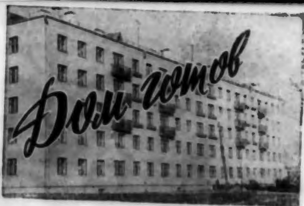
Фото и текст ♦. НАСЕДКИНА

ВОТ ОН , пятиэтажный, облицованный светлой керамической плиткой дом.