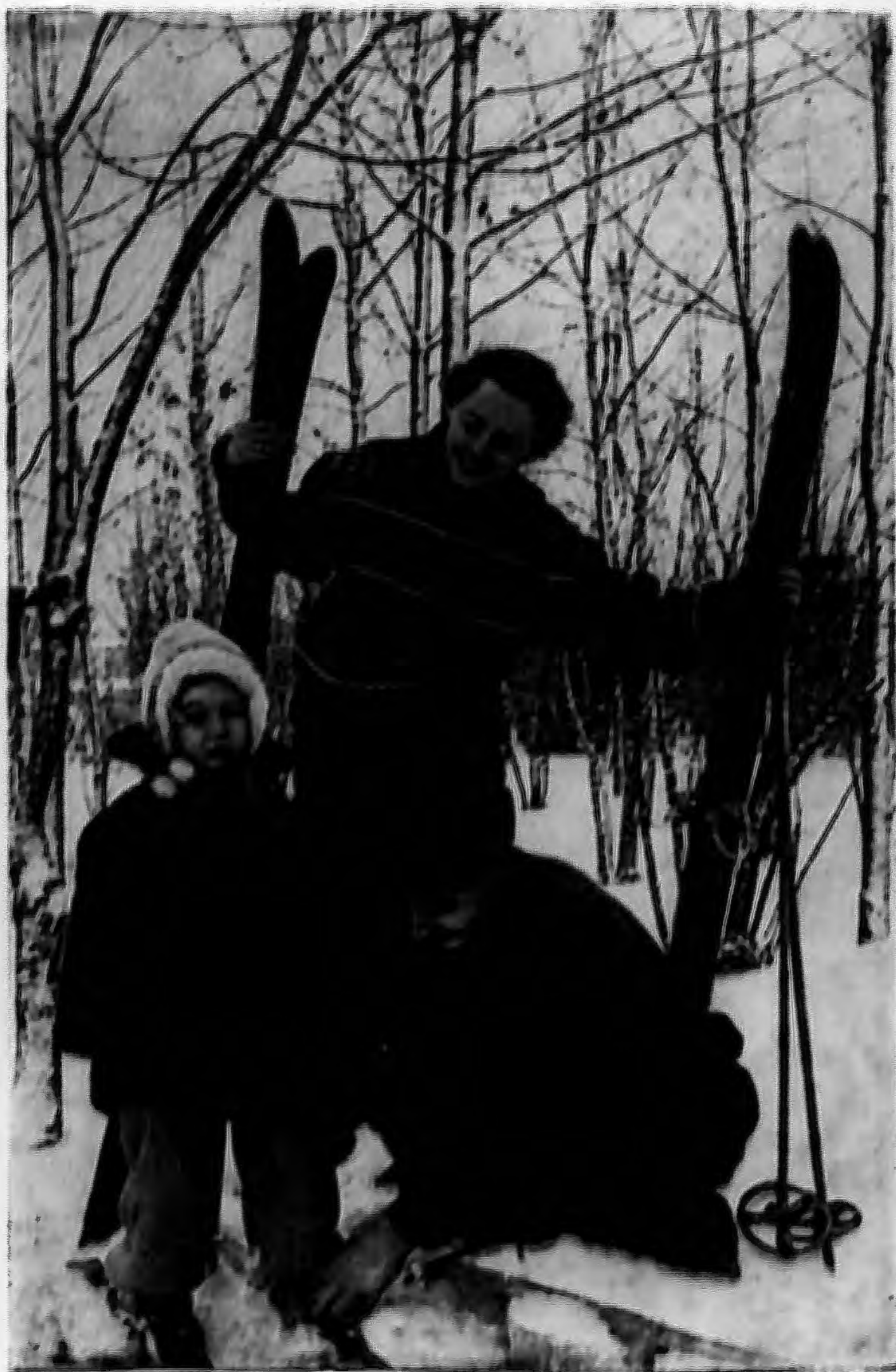
На лыжной прогулке.