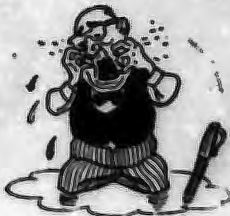
Рис. В. ФЕДОРОВА.