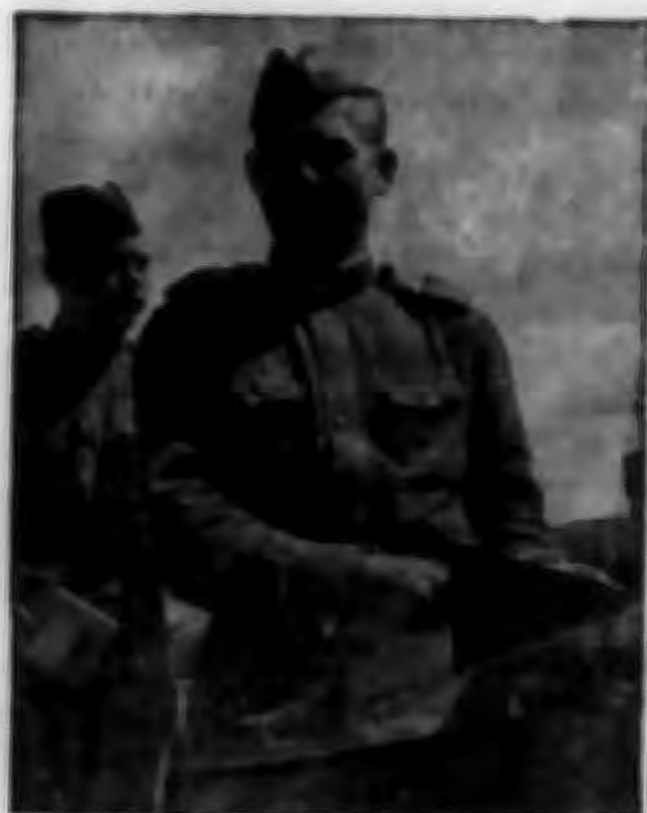
Фото № 1.

ВОТ ОН , пятиэтажный, облицованный светлой керамической плиткой дом.