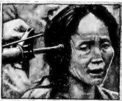
Зверские расправы с мирными жителями южновьетнамских деревень — обычное занятие солдат армии США. Так они «защищают цивилизацию».

Вьетнам, что в переводе на русский означает «Страна Юга», существует около четырех тысяч лет. На этот край, щедрый природными богатствами, издавна зарятся иноземные захватчики.