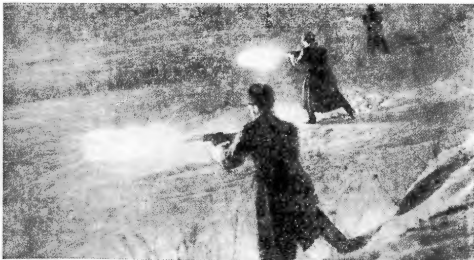
На ночных занятиях.

Свои достижения в социалистическом соревновании воины посвящают XXIV съезду родной партии.