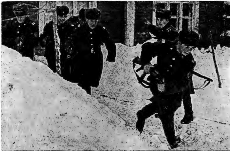
Нарушена линия охраны Быстры и решительны действия начальника войскового наряда в сложной ситуации.