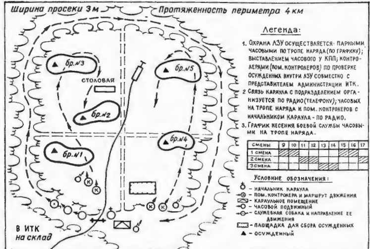
ГРАФИК СЛУЖБЫ ЧАСОВЫХ ПО ОХРАНЕ ЛЗУ (ВАРИАНТ)