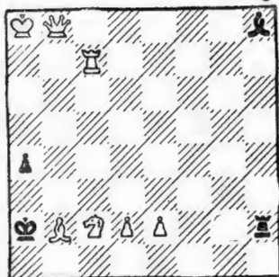
Задача № 11

Белые: Кра8, Фб8, Лс7, Сб2, Кс2, пп. d2, e2 (7).