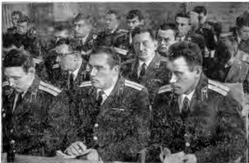
Участники Всеармейского совещания отличников на заседании секции внутренних войск.

Идя навстречу XXV съезду КПСС, мы взяли на летний период обучения более высокие социалистические обязательства. В их числе экономия горюче-смазочных материалов, автопокрышек, отличное сбережение техники и, конечно, безаварийная работа автотранспорта роты. Настроение у нас хорошее. Свое слово — работать без поломок и дорожно-транспортных происшествий — мы сдержим.