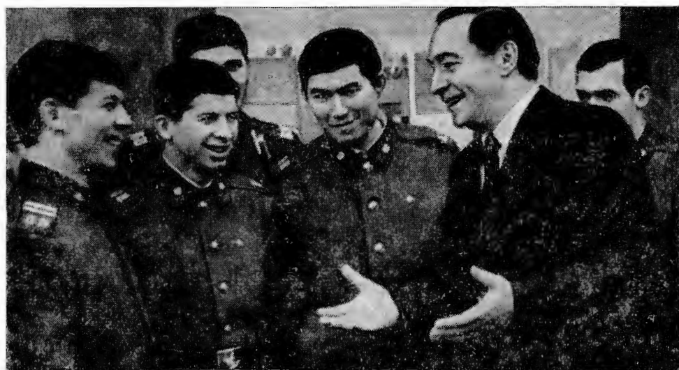
Сердечной была встреча воинов с народным артистом СССР В. Тихоновым.

Таких примеров можно привести немало. Члены группы докладчиков не ограничиваются лекциями, докладами, беседами. Они активно участ-