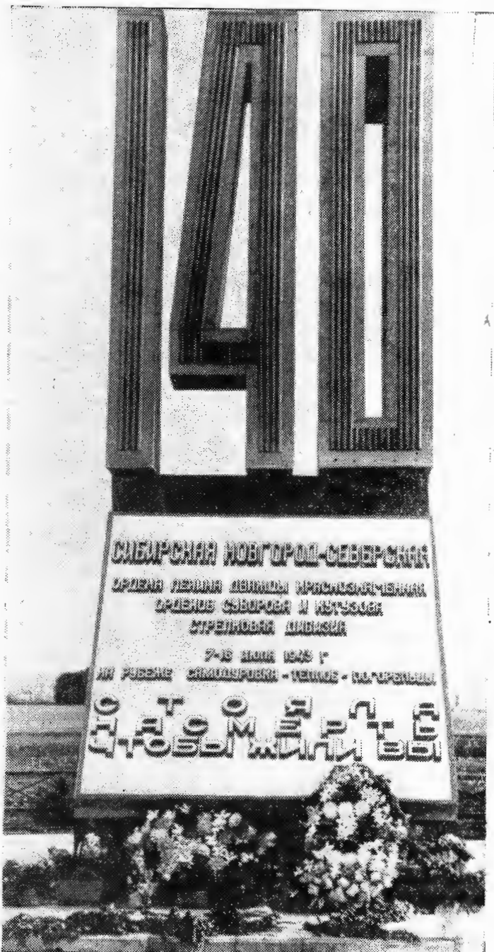
Памятный знак 140-й стрелковой дивизии, установленный на Тепловских высотах — на месте боев соединения.

6 июля дивизия получила приказ Военного совета 70-й армии выдвинуться в район Теплое — Самодуровка и задержать наступление немецко-фашистских войск, которым 5 и 6 июля удалось вклиниться в нашу оборону на 10—15 километров. На рассвете 7 июля дивизия приняла на себя