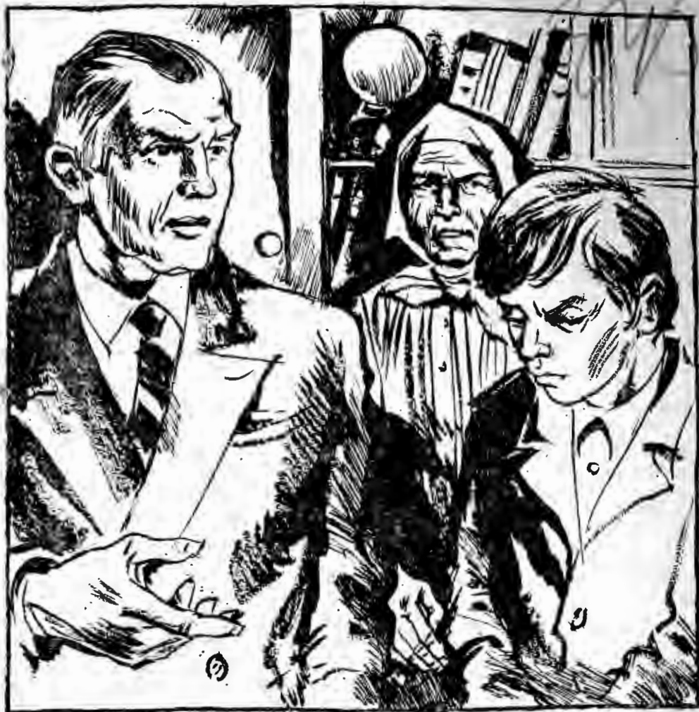
Рисунок О. ВУКОЛОВА.

в карманы и насвистывая понравившийся мотивчик. Яркое светило солнце. После первой грозы, прогрохотавшей перед рассветом, нежно пахло листвой распутившихся тополей. Занятия в школе закончились. Настроение было что надо. Его не могла омрачить даже мысль о назначенной на осень переэкзаменовке. Впереди было целое лето. К тому же сегодня в кармане позвякивала мелочь — можно было выпить газировки или купить мороженое.