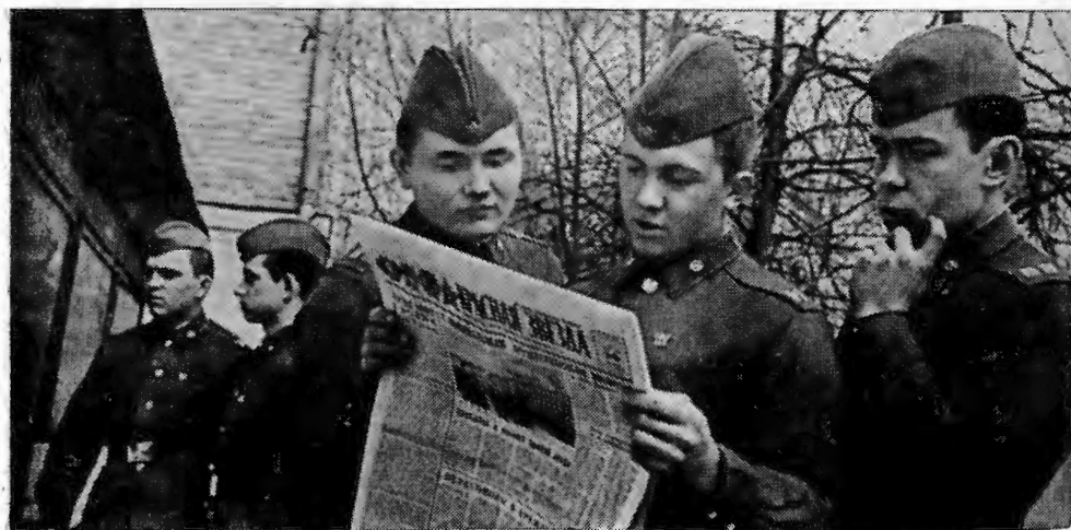
В подразделение пришли газеты.