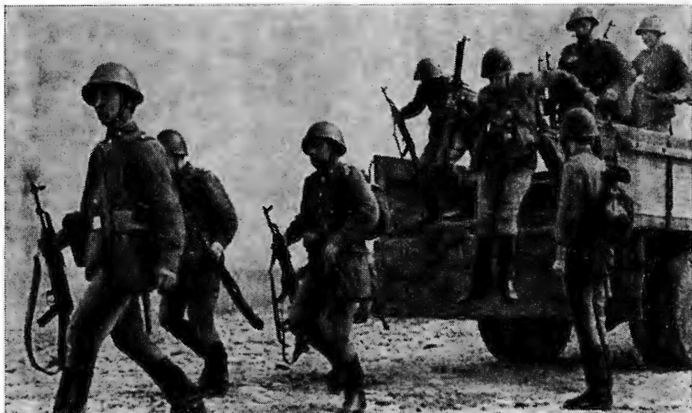
Отрабатывается норматив. Посадка на машину и высадка из нее производятся в точном соответствии с требованиями устава.

УТВЕРЖДАЯ КОНСПЕКТ показательного занятия по теме «Действия взвода по пресечению и ликвидации побега осужденного (преступника)», командир части подчеркнул, что оно должно быть комплексным по своему характеру, включать элементы тактической, огневой, военно-инженерной, физической и строевой подготовки, защиты от оружия массового поражения противника, военной топографии, проводиться на едином тактическом фоне.