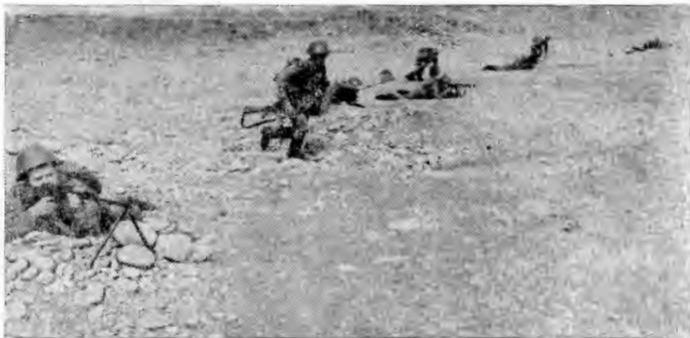
Группа окружения короткими перебежками, умело применяясь к местности, уверенно продвигается вперед. Путь отхода «преступнику» отрезан.