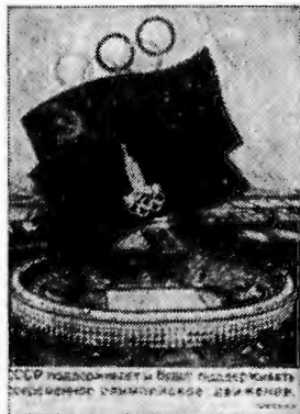
На первой странице обложки: репродукция плаката издательства «Плакат».