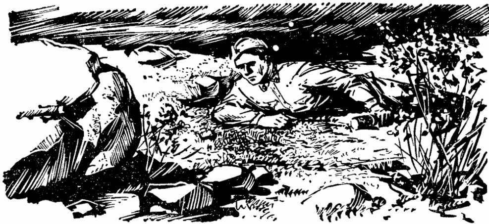
Рис. В. Дедеяна.

— Кто выжил? Не тарыхти, выкладывай по порядку,— беря свой котелок, остановил Мову Барбашов.