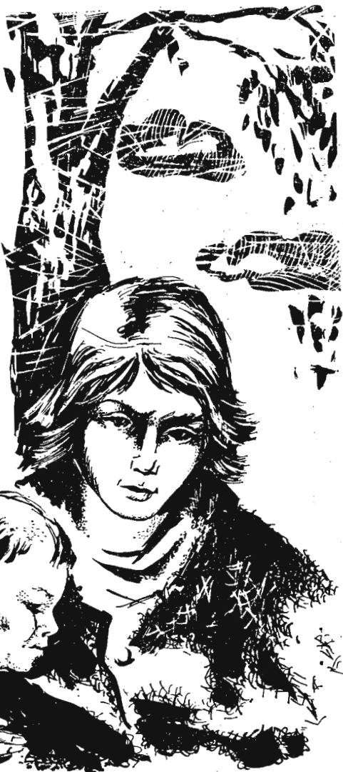
Рис. В. Лопаты.

Но Сашок уже закрыл глаза, заметался в беспамьятстве. Больше в сознание он не приходил и умер, когда над дальней светлой полоской на небе появилась другая — алая. Борончук, с силой втыкая в сухую землю охотничий нож, взятый в доме лесника, нарезал пластиы дерна,