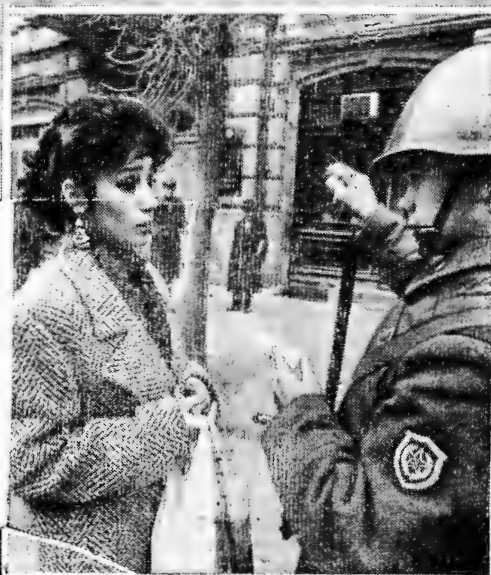
ФОТОРЕПОРТАЖ ИГОРЯ ГАВРИЛОВА, СПЕЦИАЛЬНОГО КОРРЕСПОНДЕНТА ЖУРНАЛА «ОГОНЕК» ДЕКАБРЬ 1988 ГОДА.