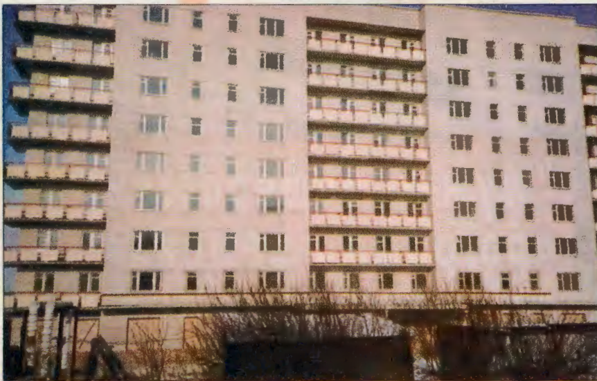
128-и квартирный дом в г. Новочеркаске

Основная трудность в том, что многие отказываются от получения государственных жилищных сертификатов по причине несоответствия суммы безвозмездной субсидии реальной стоимости жилья в регионах