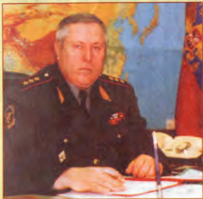
Заместитель министра внутренних дел — главнокомандующий внутренними войсками МВД России генерал-полковник Вячеслав ТИХОМИРОВ: