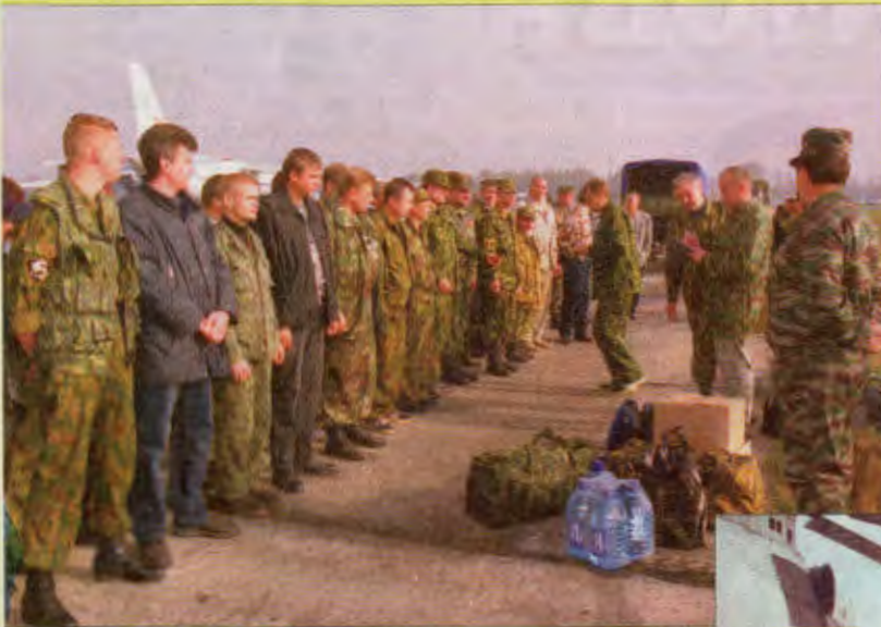
Инструктаж перед вылетом в 46-ю ОБрОН (аэропорт Чкаловский)