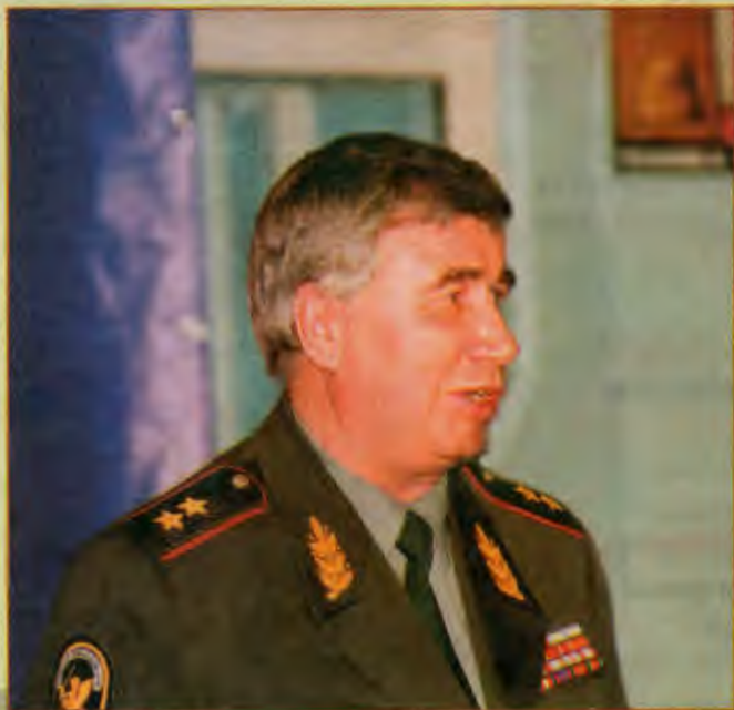
Заместитель главнокомандующего внутренними войсками МВД России генерал-лейтенант Станислав КАВУН: