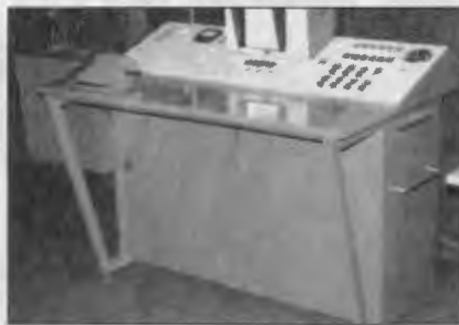
Система ТСО “Ночь-12”.

ЦИТО ВВ МВД России обладает солидной учебно-методической базой для проведения показательных занятий с различными категориями военнослужащих родственных специальностей.