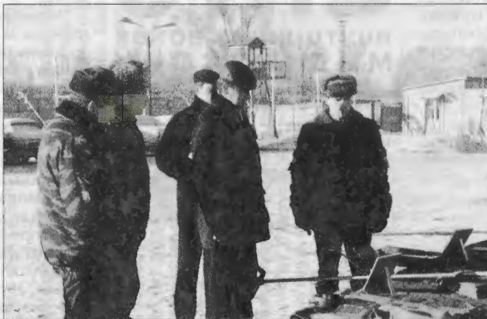
На показательных занятиях.