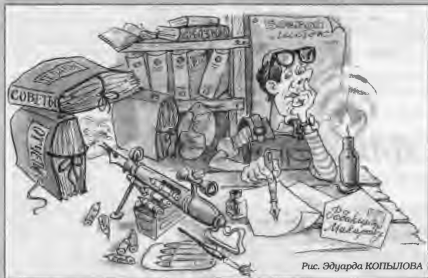
Рис. Эдуарда КОПЫЛОВА

на себя "боевые" и ушел. А советов теперь у нас стало не девять, а десять.