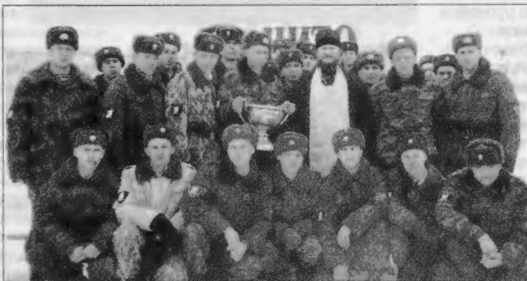
Сплав науки и отваги — инженерные войска (Из песни военных инженеров)