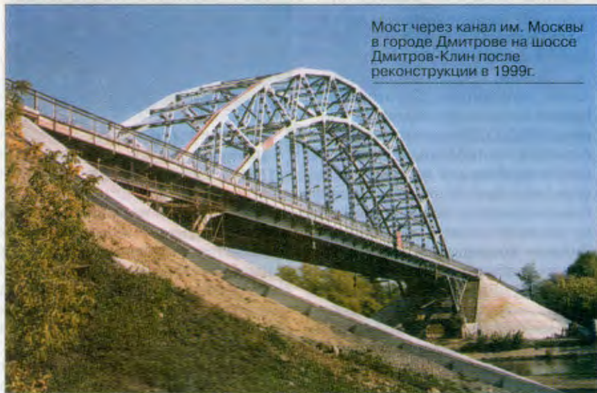
Мост через канал им. Москвы в городе Дмитрове на шоссе Дмитров-Клин после реконструкции в 1999г.

Тогда принимается решение еще раз подкопать грунт под фер-