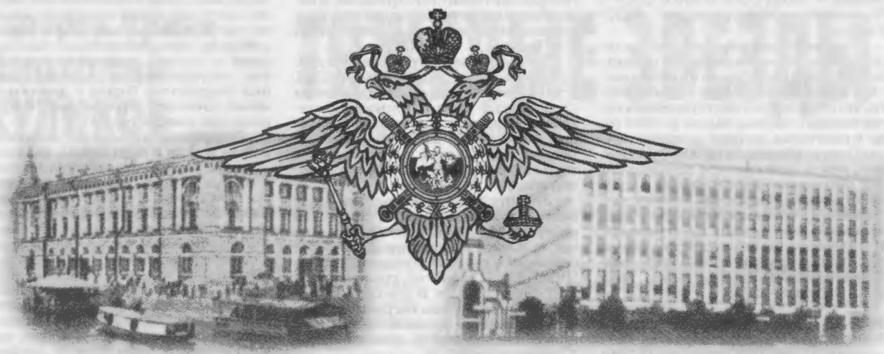
Здание МВД (1802 г.)