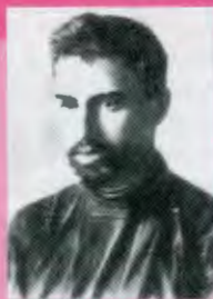
ЦЕРЕТЕЛИ Ираклий Георгиевич