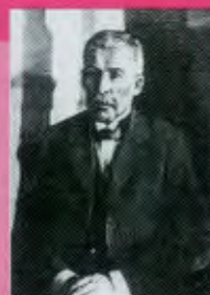
ДУРНОВО Павел Николаевич