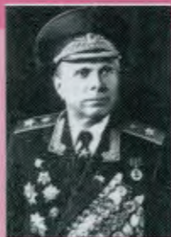
ЩЕЛОКОВ Николай Анисимович