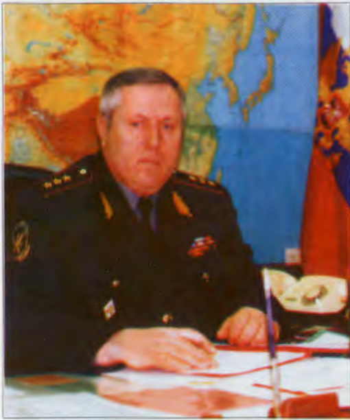
Заместитель министра внутренних дел — главнокомандующий внутренними войсками МВД России генерал-полковник Вячеслав ТИХОМИРОВ

Нынешний год, как и прошлый, для внутренних войск юбилейный. Исполняется 200 лет со дня образования МВД Российской Федерации.