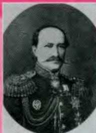
ИГНАТЬЕВ Николай Павлович