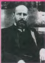
СТОЛЫПИН Петр Аркадьевич