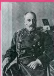
СВЯТОПОЛК- МИРСКИЙ Петр Данилович