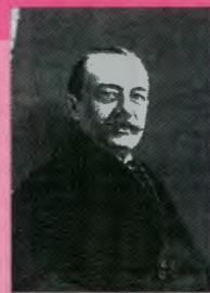
ПРОТОПОПОВ Александр Дмитриевич