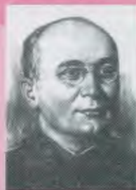
БЕРИЯ Лаврентий Павлович