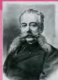
ГОРЕМЫКИН Иван Логгинович