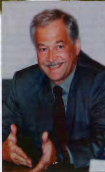
Министр внутренних дел Российской Федерации Борис ГРЫЗЛОВ

2002 год — исторический год для Министерства внутренних дел Российской Федерации, год его 200-летия, которое отмечается 20 сентября 2002 г. Два века минуло с той поры, как указом императора Александра I было образовано министерство, на которое с самого начала был возложен широкий круг задач по внутреннему благоустройству страны и укреплению порядка. Ни в один момент своей истории МВД не занималось сугубо “полицейскими” функциями, всегда его функции были неизменно шире.