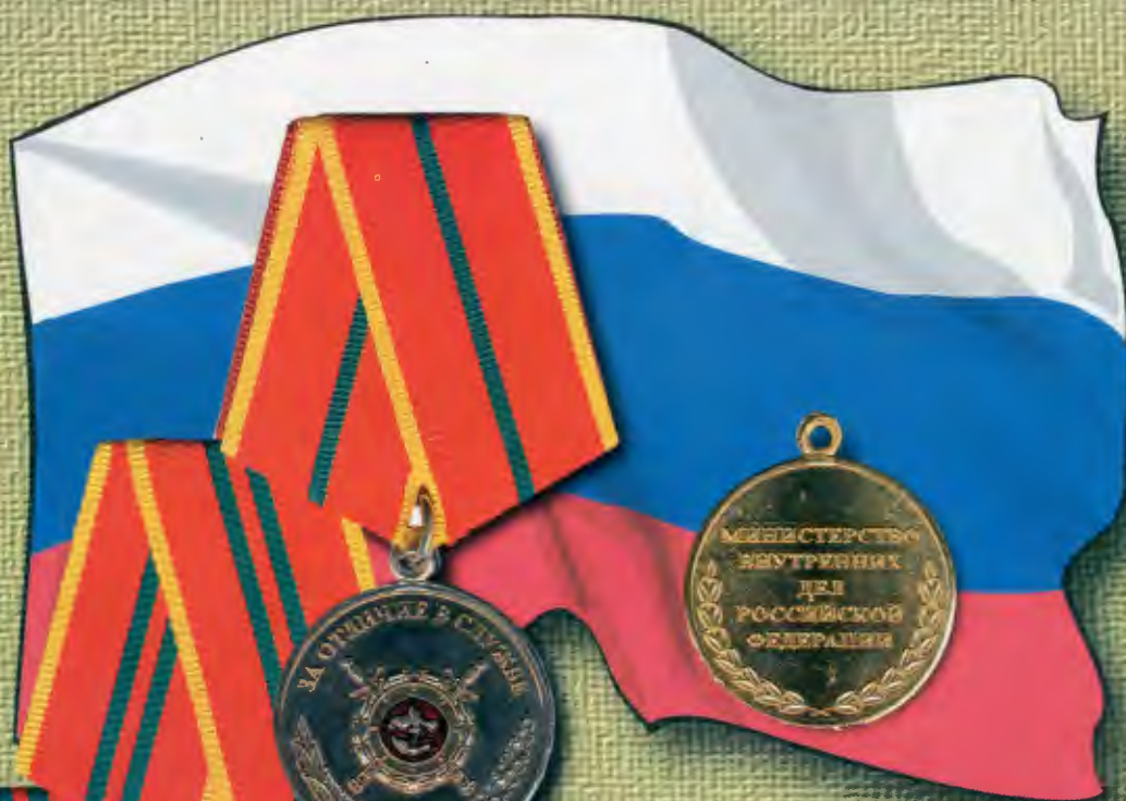
ПОЛОЖЕНИЕ о медали МВД России "За отличие в службе"

Медалью МВД России "За отличие в службе" награждаются сотрудники органов внутренних дел и военнослужащие внутренних войск МВД России за добросовестную службу, имеющие соответствующую выслугу лет в календарном исчислении.