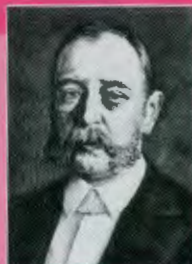
ТОЛСТОЙ Дмитрий Андреевич