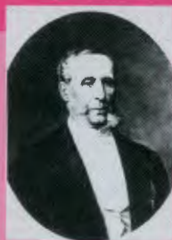
ВАЛУЕВ Петр Алексеевич