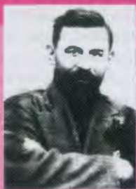
ПЕТРОВСКИЙ Григорий Иванович