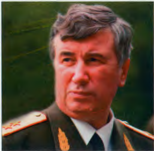
Заместитель главнокомандующего внутренними войсками МВД России генерал-лейтенант Станислав КАВУН: