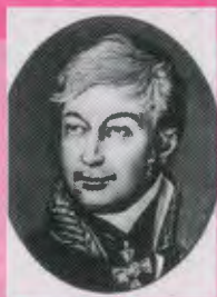
ЛАНСКОЙ Василий Степанович