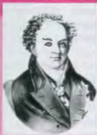
КУРАКИН Алексей Борисович