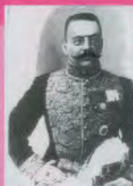
МАКЛАКОВ Николай Александрович