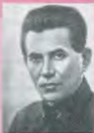
ЕЖОВ Николай Иванович