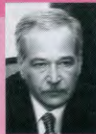
ГРЫЗЛОВ Борис Вячеславович