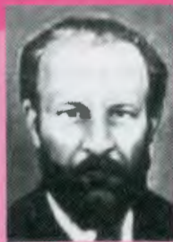
АВКСЕНТЬЕВ Николай Дмитриевич