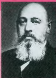
СИПЯГИН Дмитрий Сергеевич