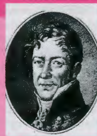
КАМПЕНГАУЗЕН Балтазар Балтазарович