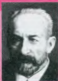
ЛВОВ Георгий Евгеньевич