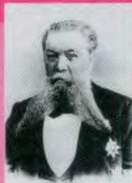
ДУРНОВО Иван Николаевич