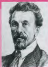
РЫКОВ Алексей Иванович