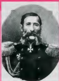
ЛОРИС-МЕЛИКОВ Михаил Тариелович