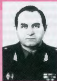
БАРАННИКОВ Виктор Павлович