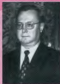
СТЕПАШИН Сергей Вадимович