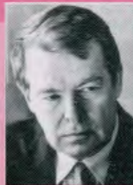
БАКАТИН Вадим Викторович