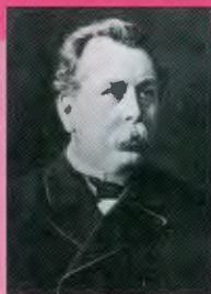
ПЛЕВЕ Вячеслав Константинович