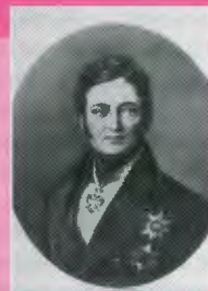
ПЕРОВСКИЙ Лев Алексеевич