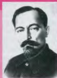
ДЗЕРЖИНСКИЙ Феликс Эдмундович