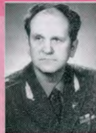
ПУГО Борис Карлович