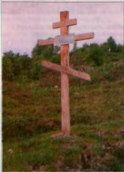
Даже памятный крест боевики используют, как метку-ориентир

зоне ответственности, где должны были пройти армейцы. Его парни сняли один фугас, обошлось без перестрелок. Вернулся поздно, уставший, голодный. Едва успел доложить о результатах, как тут же получил от командира задачу на следующий день. Завтра на Ханкалу пойдет колонна. Теперь уже своя, бригадная: оттащить в ремонт пару единиц техники, пополнить материальные и продовольственные запасы, перебросить туда-сюда людей.