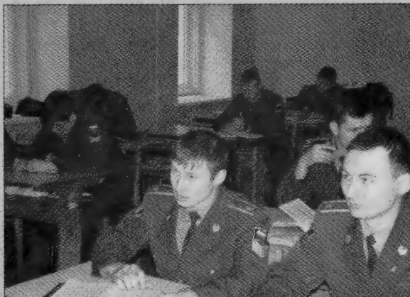
На занятиях курсанты 4-го курса.