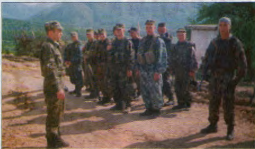
Правильно проведенный инструктаж перед выходом на ИРД спас не одну солдатскую жизнь

Без веры, пусть даже в приметы, здесь тяжело. Кто-то второпях крестится, бормоча заученную на память материнскую молитву, написанную на