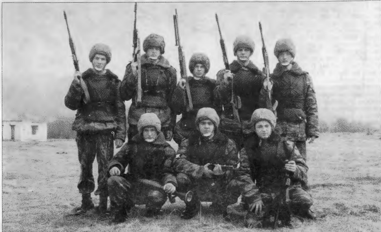
Курсанты выпускного батальона на полевых занятиях в учебном центре

вился к ним. Поздоровавшись с одним из них, он крикнул: