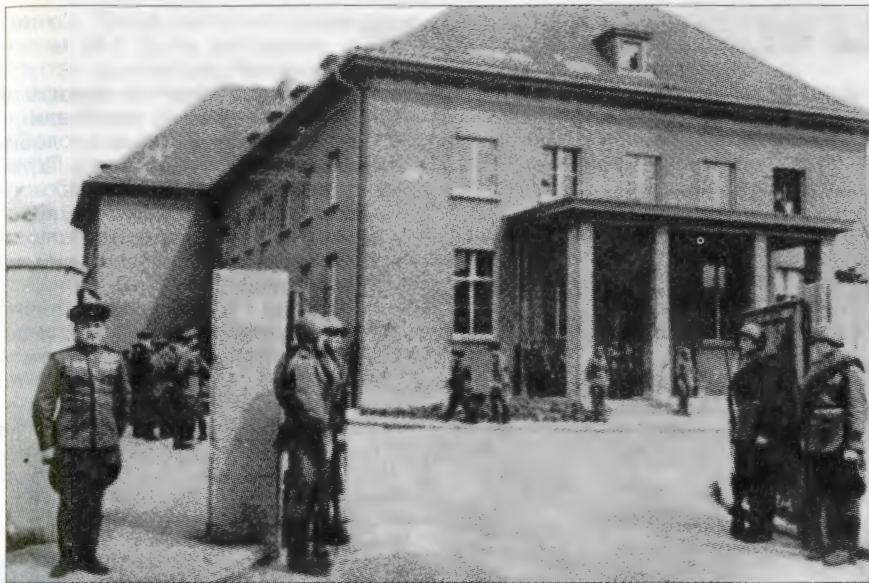
Военнослужащие 105-го погранполка, Потсдам, 1945 год

Первое пленарное заседание конференции состоялось 4 февраля, и затем они проходили ежедневно. И.В. Сталин на правах хозяина — ведь Ф. Рузвельт и У. Черчилль были все-таки гостями — всегда входил в зал заседаний последним. Вспоминая те дни, У. Черчилль в декабре 1959 года во время выступления в палате лордов Великобритании по случаю 80-летия И.В. Сталина сказал: «Сталин производил на нас неизгладимое впечатление. Его влияние на людей было неотразимо. Когда он входил в зал Ялтинской конференции, все мы словно по команде вставали и, странное дело, почему-то держали руки по швам».