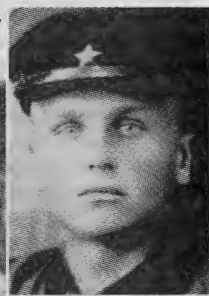
Фото 1941 года

Странными и удивительными кажутся причуды человеческой памяти: иной раз никак не могу отыскать только что снятые очки и в то же время помню многое из того, что происходило со мной и моими боевыми друзьями полвека назад — в годы войны. Казалось бы, уже всё сказано о той гигантской кровопролитной битве нашего народа против смертельного врага. Но память ветеранов делает достоянием общественности все новые и новые факты. Вот и я, бывший фронтовой сержант, решил поделиться с вами своими воспоминаниями.