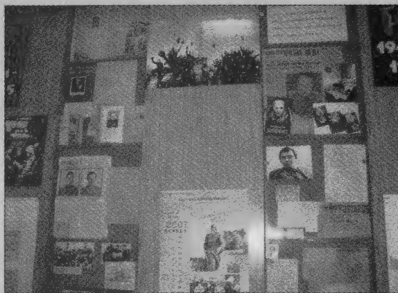
Методический кабинет кафедры. Здесь собрана вся история военной печати.