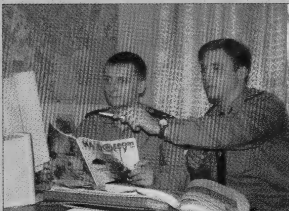
Выпускники кафедры — корреспонденты журнала "На боевом посту".