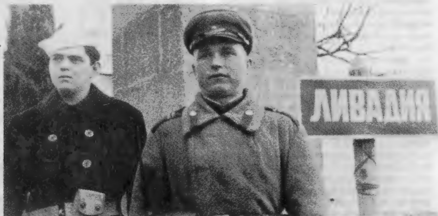
Советский и американский военнoслужащие на охране Крымской конференции, февраль 1945 года

Победный 1945-й начинался сокрушительными ударами Красной Армии по немецко-фашистским войскам. 12-13 января развернулись крупнейшие стратегические операции Советских Вооруженных сил — Висло-Одерская и Восточно-Пруская, в ходе которых противнику нанесено очередное поражение. В них было разгромлено 60 германских дивизий, еще 37 — потеряли от 50 до 75 процентов своего личного состава. Советские войска освободили почти всю Польшу, овладели Восточной Пруссией, вышли на территорию Германии.