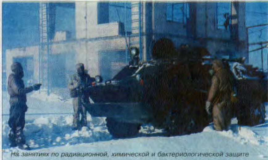
На занятиях по радиационной, химической и бактериологической защите

Говоря о проблемах боевой подготовки, нельзя обойти стороной вопросы совершенствования учебно-материальной базы (УМБ). И снова на память (поистине классика бессмертна) приходит суворовское: «Поле — академия солдата». А если оно еще и соответствующим образом оборудовано... По мнению офицеров управления боевой подготовки, необходимость в ремонте, а то и замене старого оборудования в учебных центрах округов и соединений войск назрела давно. Там следует обустроить новые учебные места, усовершенствовать инфраструктуру. Словом, довольствоваться тем, что есть, сегодня уже нельзя. Это хорошо понимают в Северо-Кавказском, Московском округах