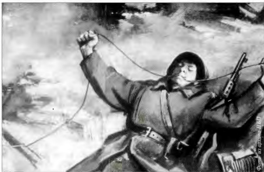
Подвиг Григория Прокопенко

Вскоре вражеская мина разорвалась на позиции одного из расчетов. Упал на станину орудия наводчик Самарин. Пушка замолчала. Левкин и Строганов переглянулись. Политрук понял, что от него требуется. Рывок — и он уже на боевой позиции. Привычными движениями зарядил орудие, приник к панораме. Выстрел — и вспыхнула еще одна вражеская машина. На помощь Строганову подбе-