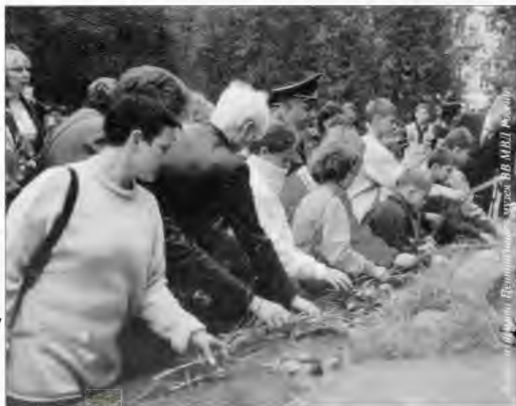
Фото Петербурга ВВ МВД России