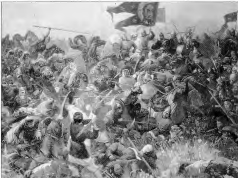
Н. Присекин. Куликовская битва