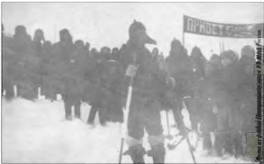
Встреча в Онежске

По Енисею группа дошла до Туруханска, вышла за Полярный круг в снежное царство Тазовской тундры и сразу же попала в сильнейшую пургу. Снег шел сплошной стеной.