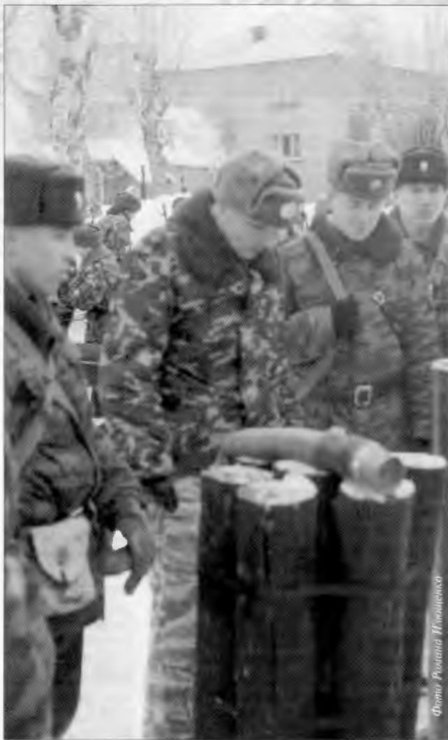
Сегодня занятия проводят лейтенанты. А завтра?

А что, если потеснить медиков полка, разместив се-