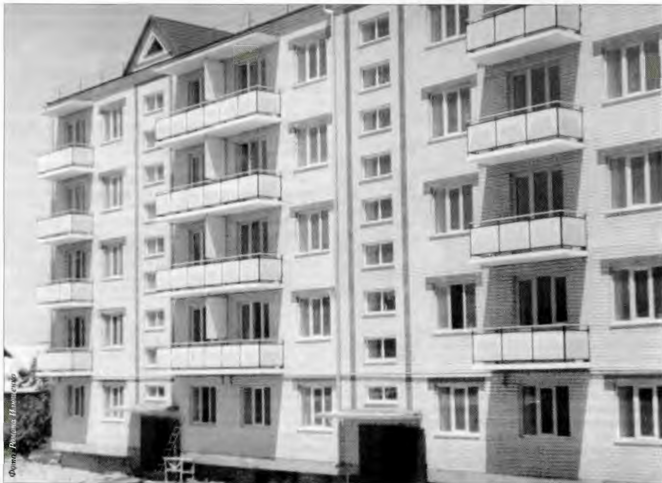
Для кого-то это уже реальность. А для кого-то пока мечта...