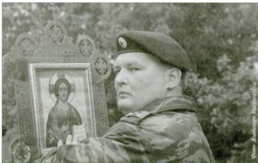
С нами Бог!

От автора. При подготовке статьи использованы труды историков Д.И. Иловайского, П.Н. Савицкого, Г.В. Вернадского, Л.Н. Гумилева, В.В. Кожинова, Е.А. Разина, Н.А. Клепина.