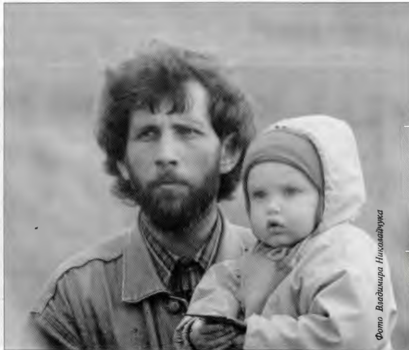
Фото Владимира Николаевича