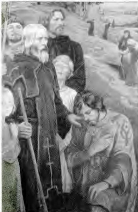
Ю. Рахца. Благословение на битву

диционное жизнеустройство, свой национальный облик и духовный мир, свою экономику и культуру. Это было обусловлено веротерпимостью и политической лояльностью ордынских ханов. Даже принявшие мусульманство степные власти не посягали на православную веру и государственную автономию Руси. На покоренных русских землях не было ни военных гарнизонов завоевателей, ни ханских наместников. Более того, взимая дань, кстати, весьма необременительную (от общей суммы налога для монгольской власти на душу населения в XIV веке приходилась всего одна десятая тогдашней копейки в год — цена 1,6 кг хлеба), татары обеспечивали военную защиту "Русского улуса" от внешних врагов, угрожавших самому существованию Руси. Как свидетельствуют исторические документы, под влиянием православного духовенства ордынские правители в союзе с русскими князьями неоднократно принимали акции против наступавшего католицизма. Наряду с этим оберегались духовные ценности православия. Так, начиная с 1267 года ханы Орды предоставляли русской церкви специальные ярлыки, согласно которым, в частности, за оскорбление церковей, хуление веры, уничтожение церковного имущества полагалась смертная казнь.