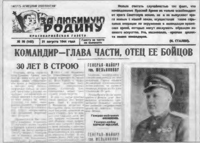
Многотиражная газета 33-й дивизии войск НКВД по охране железных дорог "За любимую Родину" от 21 августа 1944 г. со статьей А. Мельникова "Героическая оборона Тулы"

зов, а также важные объекты областного центра. Караулы и войсковые наряды постоянно сопровождали пассажирские и грузовые составы. Перед воинами-чекистами ставилась задача не только не допустить несанкционированного проникновения на охраняемые объекты, но, образно говоря, чтобы мышь не могла проскочить незамеченной в город.