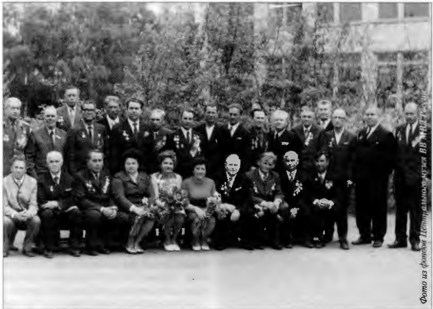
Ветераны легендарного бронепоезда