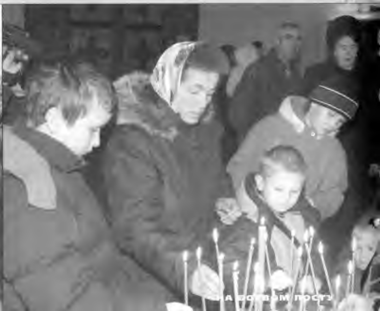
НА ВОЗВРАТ ПОСЛА