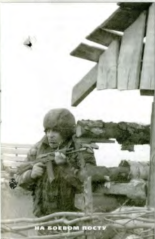
НА БОВЕВМ ПОСТУ