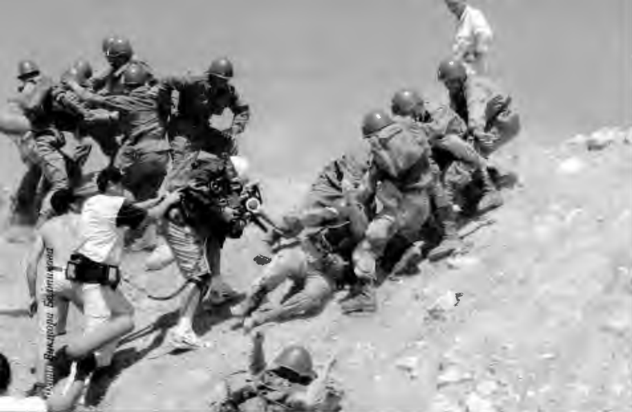
Фильм «Высота» Сергея Соловьева