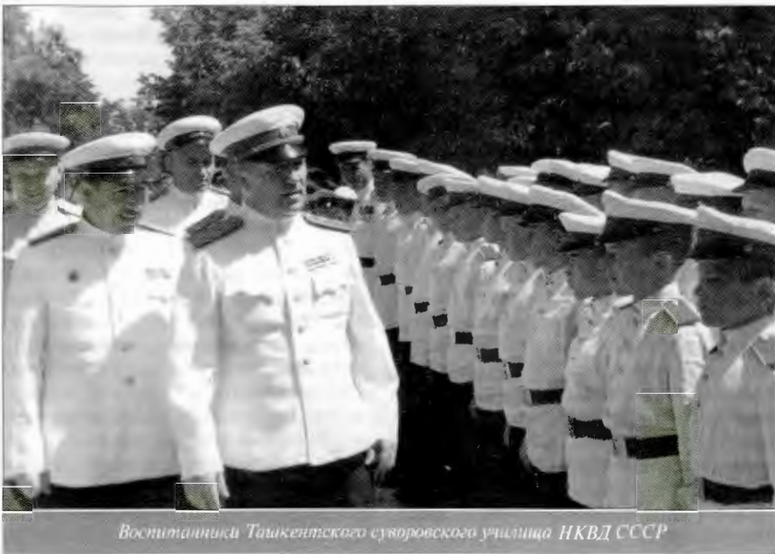
Воспитанники Ташкентского суворовского училища НКВД СССР

Проблема возникает и когда речь заходит о материальном обеспечении учебного процесса. Заказчик, то есть ГКВВ, твердит: "Мы деньги за все платим, пусть вас обеспечивает вуз", а здесь слышим: "Пусть дают войска". А ведь для подготовки специалистов внутренних войск, выпол-