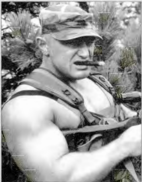
Кадр из фильма "Спецназ по-русски-2"