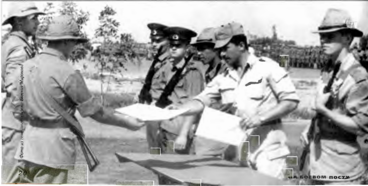
Прислгая Отечеству: Фергана, 1990 г.

Командование прекрасно пони- мало, что с каждой минутой положе-