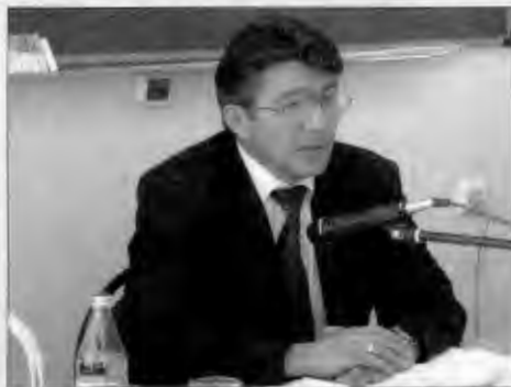
В.А. Озеров, председатель Комитета Совета Федерации по обороне и безопасности

В середине июня в бригаде оперативного назначения Московского округа внутренних войск, расположенной в Софрино, состоялось выездное заседание Комитета Совета Федерации по обороне и безопасности на тему: "Проблемы законодательного обеспечения правоохранительной деятельности внутренних войск МВД России". В работе комитета участвовали члены Совета Федерации, сотрудники аппарата комитета, представители Главного правового управления МВД РФ, Главного командования внутренних войск МВД России и командования Московского округа внутренних войск МВД России.