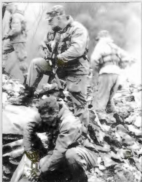
Кадр из фильма "Спецназ по-русски-2"

стью атрофировано. Человеку через несколько минут нужно с мотоцикла слететь или со стометровой вышки сигануть, а он смехом заливается. Меня иногда просят в таких случаях сделать так, чтобы ему страшно было. Чаще получается. Много нюансов и с заключительными этапами программы, когда участники по сценарию должны ответить в камеру на вопросы. Тут ведь ситуация какая — прошел этап, и эйфория сразу началась, тебе уже ничего не страшно.