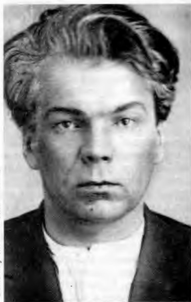
Фото из уголовного дела Ольского