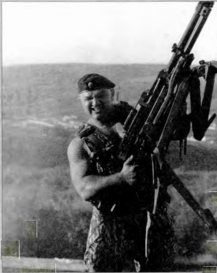
Кадр из фильма "Спецназ"