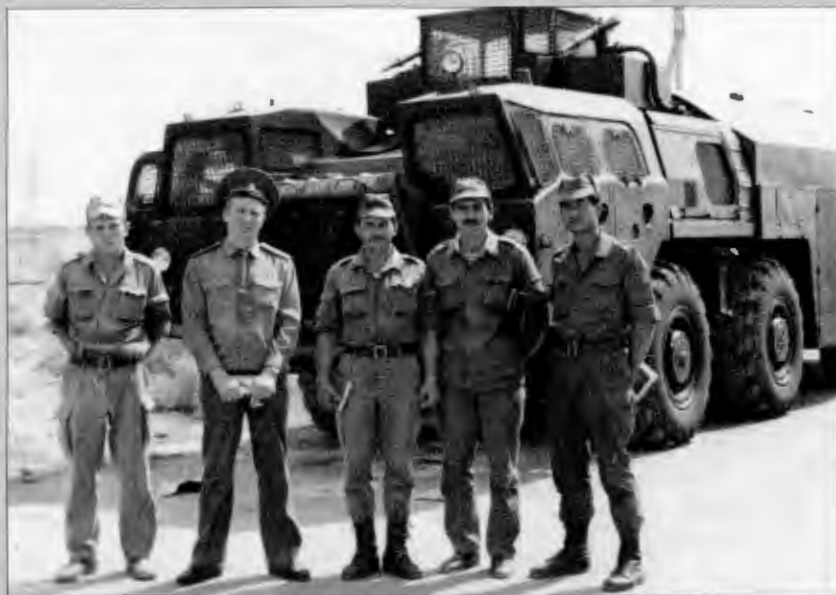
Фергана, 1990 г.

вуза. Ему, красnodипломнику, предлагали на выбор лучшие перспективы — службу в Группе советских войск в Германии или в не менее престижной Москве, а он... отказался.