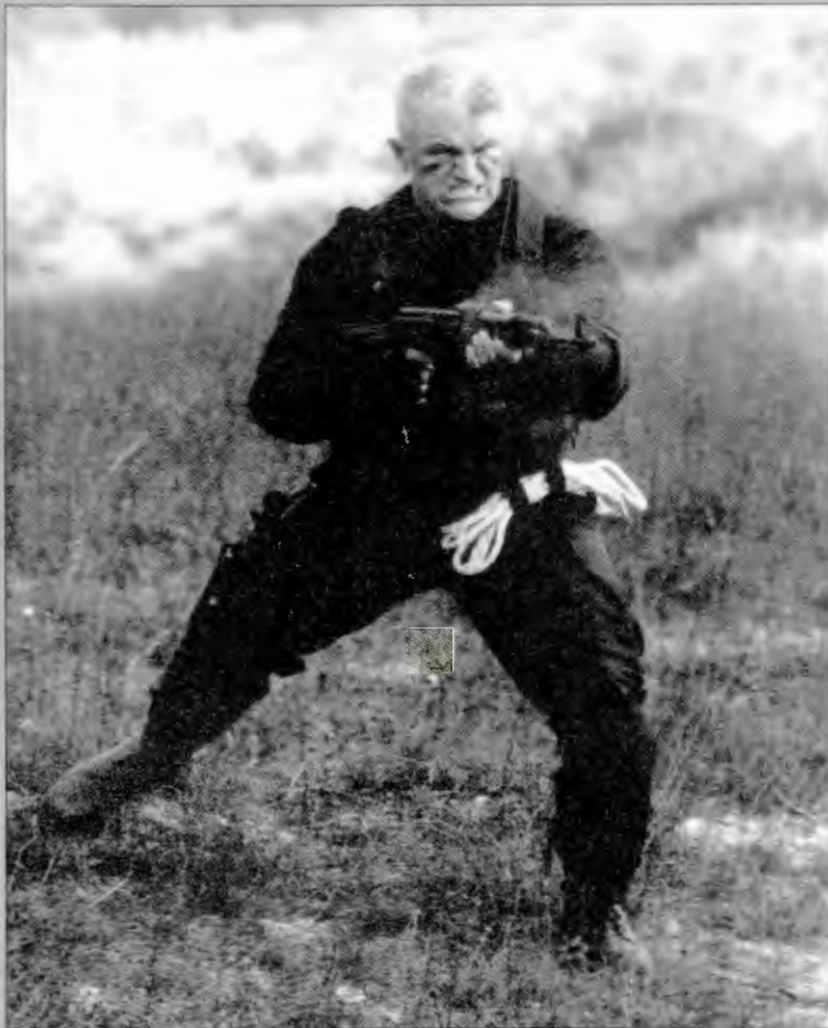
Кадр из фильма "Спецназ по-русски-2"

— На трюки, как правило, у создателей фильма много финансов и времени не уходит, вот и приходится каскадерам подвиги совершать. В фильме "Родина ждет" трюки снимались две недели — это рекордное время, в той же "Матрице" трюки снимались 4 месяца... В "Таллинском экспрессе" пять драк снимали за одну смену. Соответственно, люди устают, теряют координацию. А один раз мне физиономию разворотили так, что... По сюжету в фильме меня пытал чеченец, которого играл татарин из русского драмтеатра. Он вошел в роль и так вмазал, что мало не показалось. Хорошо у меня руки в наручниках были, а то бы я ему ответил как положено. В другой раз сказали, что будут снимать мой поединок