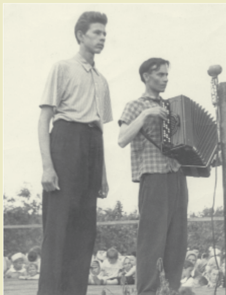
В Чувашском оперном театре.