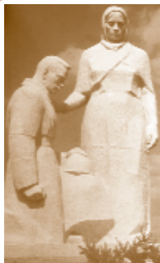
Памятник воинам, павшим в боях за Москву. Боровский район Калужской области.