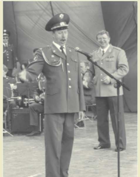
В Академическом ансамбле песни и пляски внутренних войск.