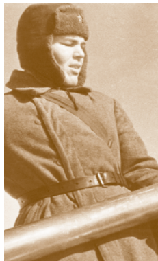
Уничтожить прорвавшегося врага.