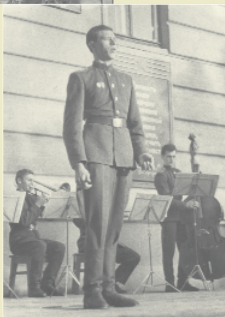
Срочная служба в полковом оркестре.