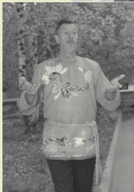
На концерте в ОДОНе.