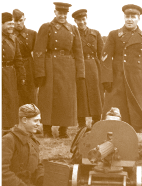
На участке обороны ОМСДОНА под Москвой.