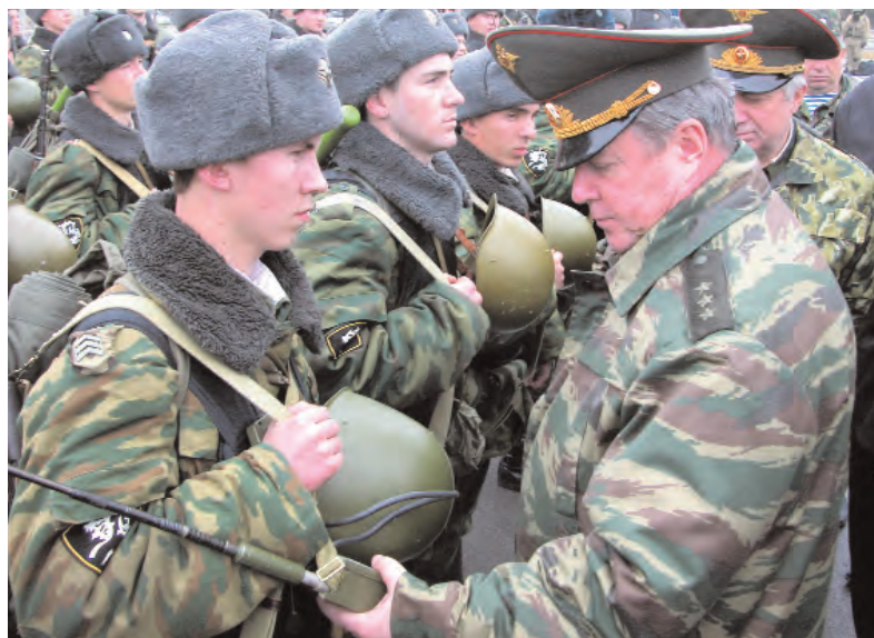
Во время проверки ГрОУ в ЮФО

Во внутренних войсках трехкомпонентная структура: части опе-