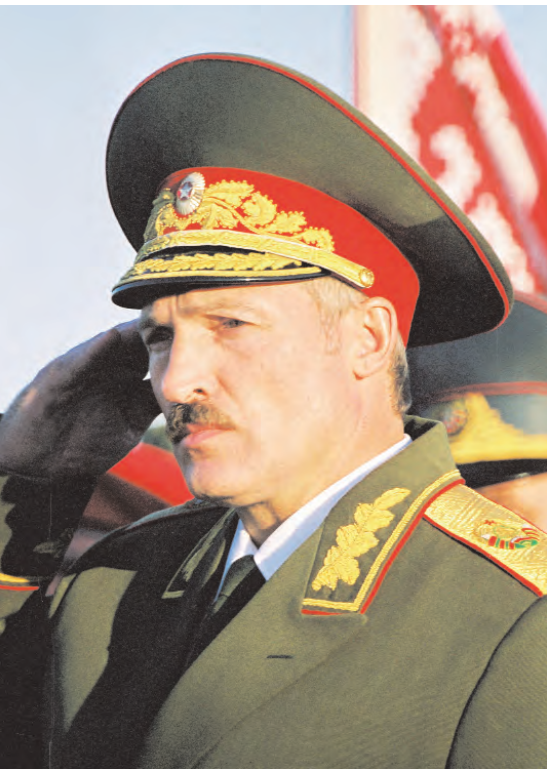
Президент Республики Беларусь, главнокомандующий вооруженными силами Республики Беларусь А.Г. Лукашенко

вавшей недавно интервью вице-президента Академии геополитических проблем РФ генерал-полковника Леонида Ивашова: "Окончательное военно-экономическое блокирование России невозможно, пока с нами Беларусь... Для России первостепенное значение имеет военное сотрудничество с Беларусью. Белорусский клин на границах с западным миром обеспечивает пока едва ли не единственный серьезный разрыв в "петле анаконды". А это архиважно для успешного противостояния нашей страны агрессивным устремлениям НАТО..."