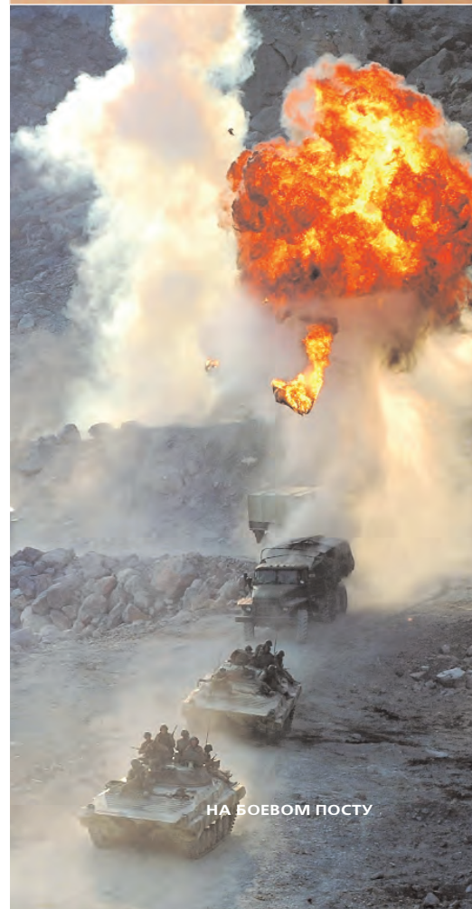
НА Боевом ПОСТУ