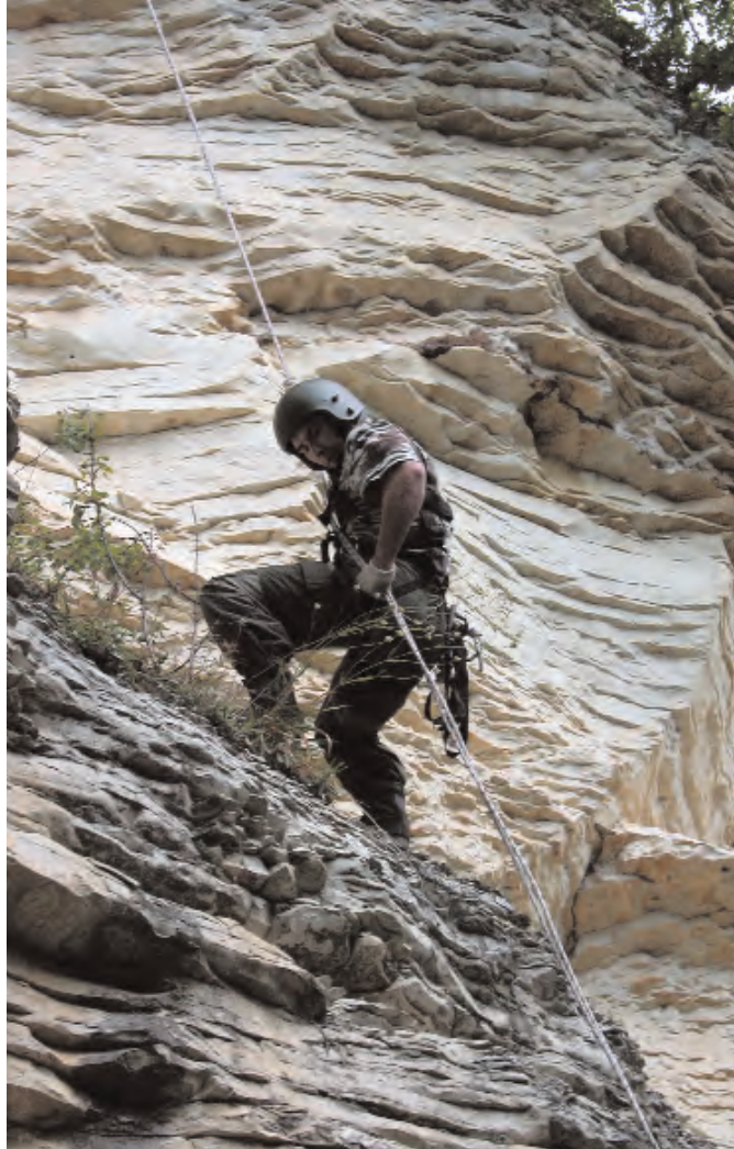
На занятиях в центре горной подготовки

вичу за то, что он делает для внутренних войск в Москве, и относимся к нему с большим уважением.