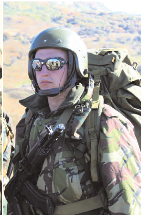
Различные варианты формы одежды военнослужащих горных подразделений

ративного назначения, части по охране важных государственных объектов и сопровождению грузов и моторизованные части. Мы боремся с бандитами на территории Южного федерального округа, а также совместно с органами внутренних дел несем службу на территории всей России. Территориально присутствуем в 39 субъектах Федерации — от Калининграда до Южно-Сахалинска, от Мурманска до Махачкалы.