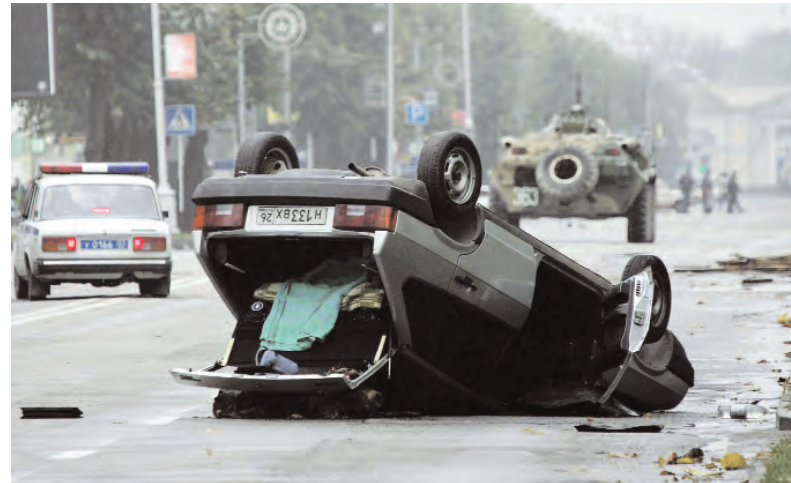
Последствия неудавшейся атаки бандитов в Нальчике