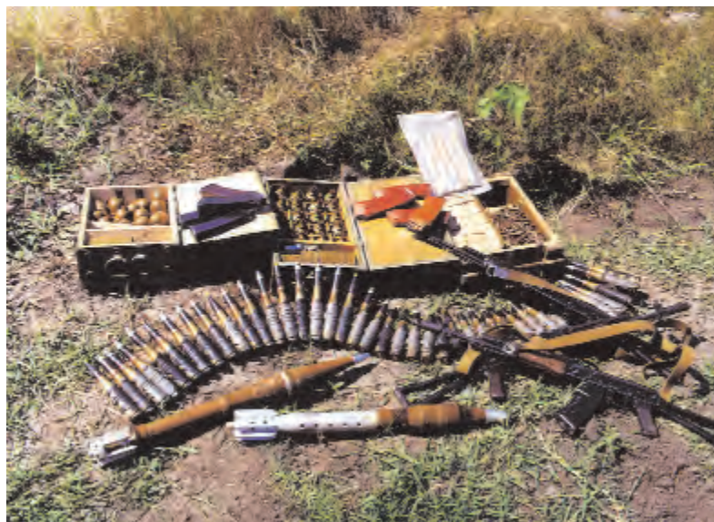
Это лишь малая часть трофеев, обнаруженных у боевиков этим летом