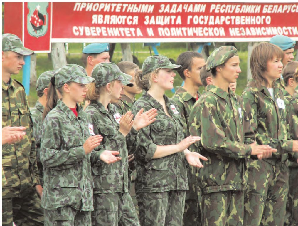
Белорусская молодежь, храня память о героическом прошлом, с оптимизмом смотрит в будущее

В Беларуси практически нет так называемых “уклонистов” или “отказников”. Злостных нарушителей призывного законодательства во всей стране лишь 17 человек. Все они находятся под контролем военкоматов, а также правоохранительных органов и неминуемо понесут ответственность за свои действия. Кстати, согласно новому Закону “О внесении изменений и дополнений в некоторые законодательные акты Республики Беларусь по вопросам воинской обязанности” эта ответственность ужесточилась. Исчезли и некоторые лазейки в законодательстве, пользуясь которыми