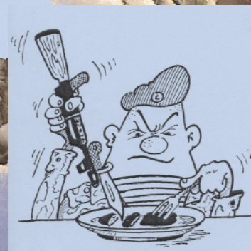
Рис. Юрия КУМЫКОВА