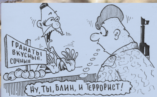
Рис. Юрия КУМЫКОВА