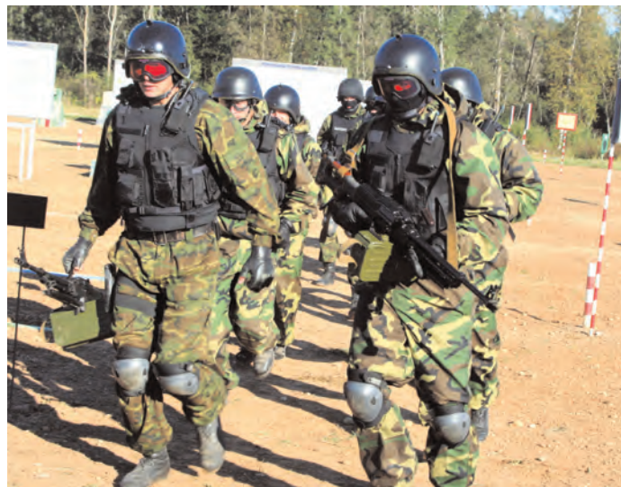
Боевая учеба отряда спецназа "Алмаз" МВД РБ

Уже в вагоне стал просматривать белорусские газеты, купленные в крайний день на-