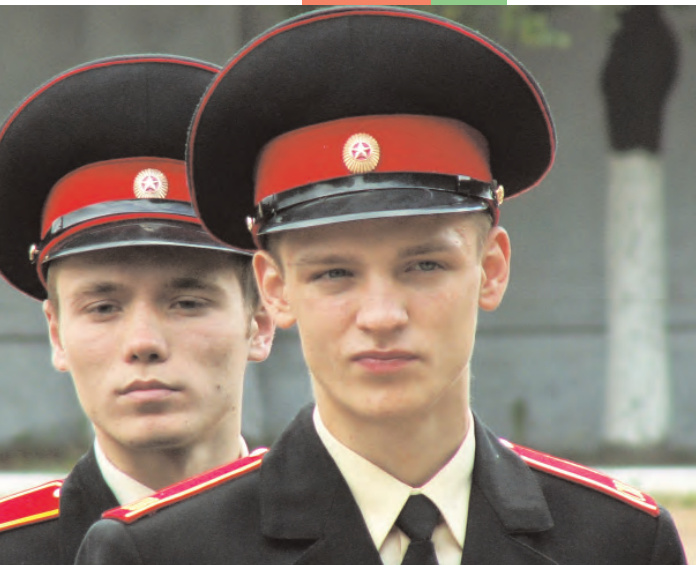
Минские суворовцы – будущая элита офицерского корпуса