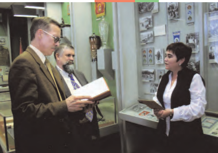
Народный музей истории ДОСААФ в Минске – хранитель нашей общей истории