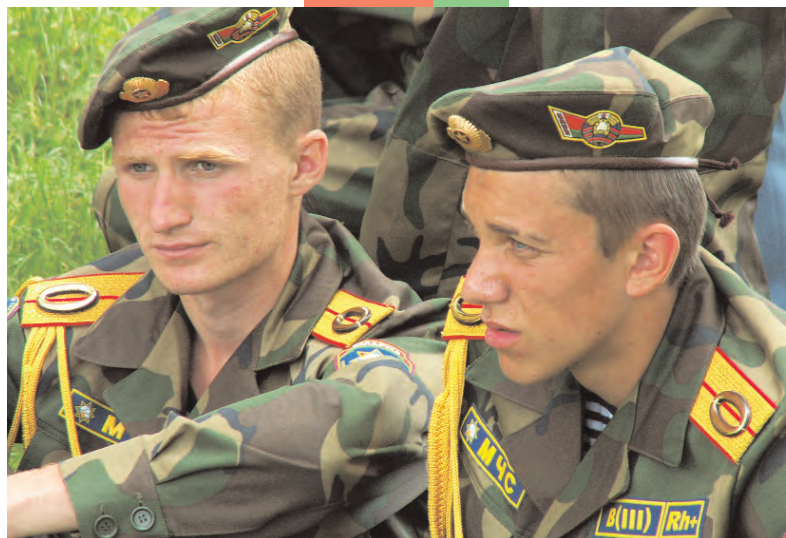
Сегодня — юнармейцы, завтра — солдаты