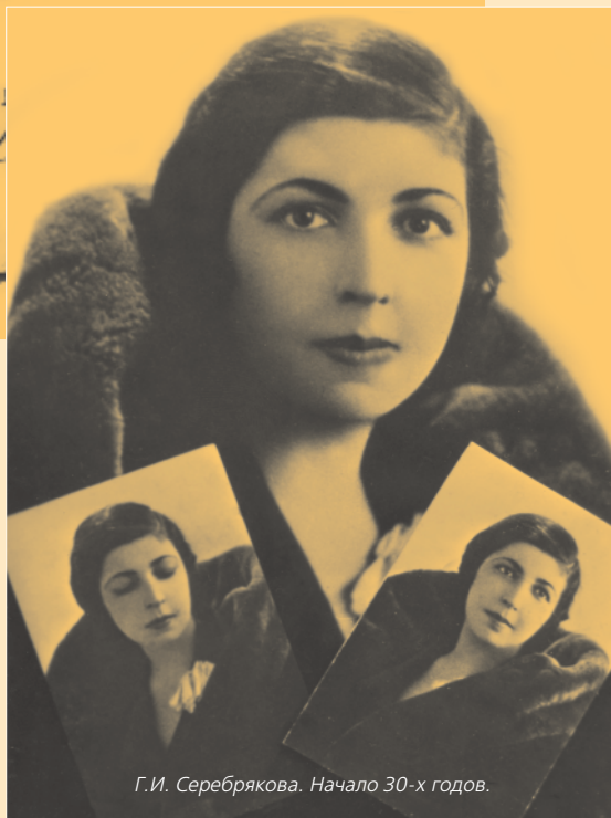
Г.И. Серебрякова. Начало 30-х годов.

Лишь несколько месяцев была будущая писательница политработником во внутренней охране. Но этот кусочек ее жизни тоже остался уроком сурового мужества, жизненной стойкости. Ее горячему юному сердцу была близка и понятна царившая в те дни в войсковых частях атмосфера подъема, готовности к подвигу, революционного энтузиазма. Она с головой окунулась в дело, убедившись, что это отнюдь не тихая заводь тыловых учреждений и казарм, а по-настоящему боевая работа, очень нужная в то сложное время, сопряженная с опасностью и риском. С волнением читала она поступавшие в ПУР резолюции красноармейских митингов, в которых бойцы единогласно просили командование "не медля ни минуты, отправить на фронт бороться против панской своры и всех паразитов трудящихся масс".