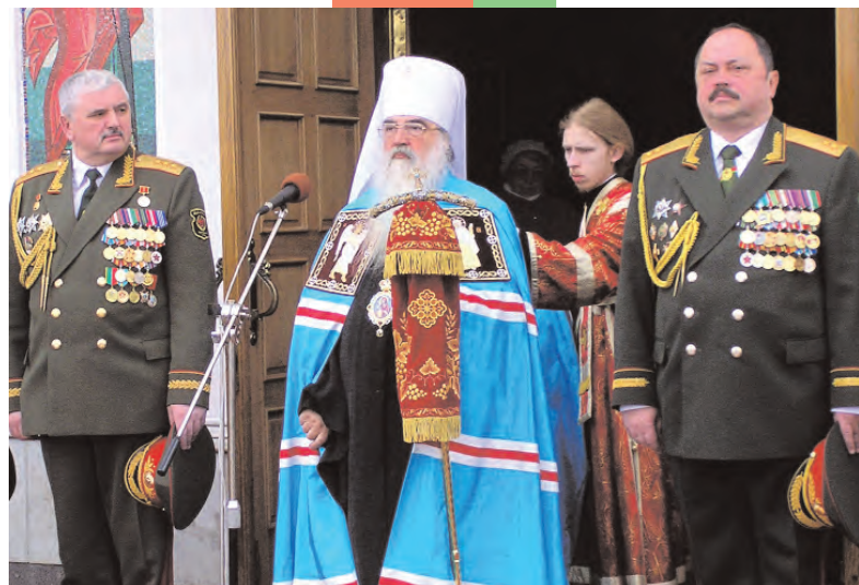
Защитники Беларуси благословляются на ратное служение Отечеству

Потом мы поехали в Брестскую крепость, осмотрели мемориал, сфотографировались на память с будущими солдатами. Вспомнилась песня военных журналистов: “От Москвы до Бреста...” Естественно, захотелось посетить и знаменитую Беловежскую Пушу. Теперь здесь государственное природоохранное учреждение, нацио-