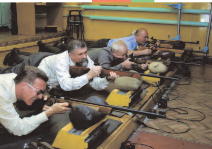
В ДОСААФ Беларуси работают сотни стрелковых тиров